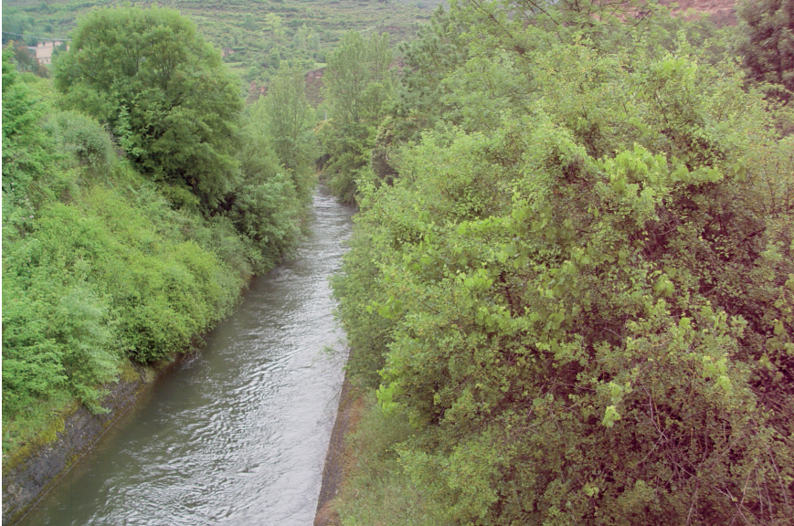
Fig. 6. El mantenimiento o mejora de las instalaciones hidráulicas del Nájerilla pueden amenazar a ejemplares como el 1D05.