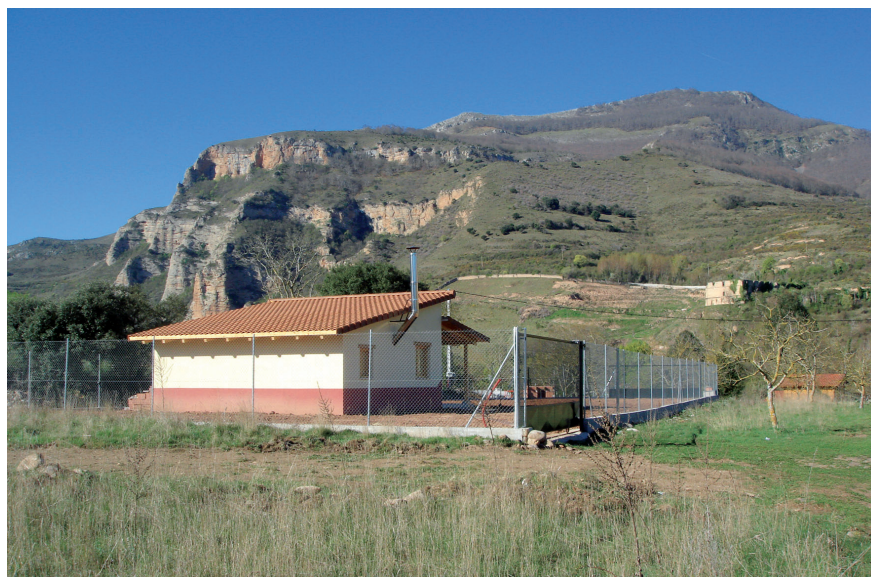
Fig. 3. Construcciones no planificadas paisajísticamente en las proximidades del ejemplar 1D05.

En las figuras siguientes se muestran gráficamente algunos ejemplos de los peligros y de las amenazas relacionados anteriormente.