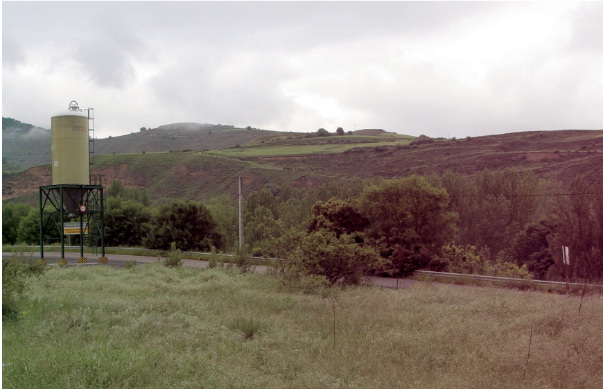
Fig. 4. Amenaza de salinización del suelo por accidente o manejo inadecuado del silo de sales fundentes situado en las proximidades del ejemplar 0F01.