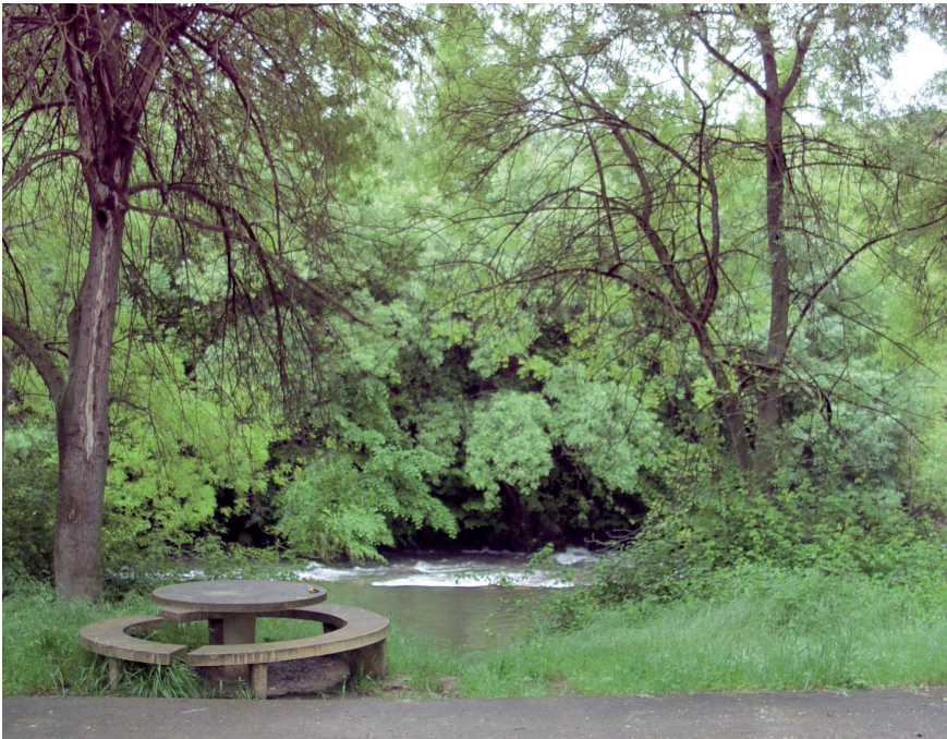
Fig. 7. Actividades lúdicas diseñadas sin tener en cuenta la protección de la población de vid salvaje. Área recreativa “Cuesta Vedada”.