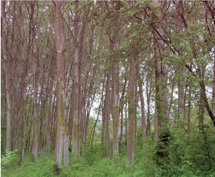
Fig. 8. Repoblaciones y tratamientos silvícolas no respetuosos con la población de vid salvaje.