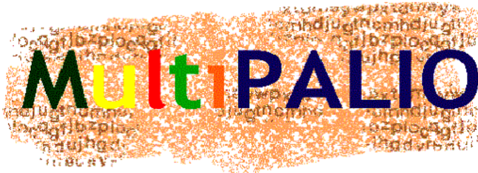
Fig. 1. Imagen corporativa del programa europeo de formación

para continuar autónomamente la actividad y ampliar el círculo de los servicios ofertados. Este grupo de Agencias especializadas en la Formación de Gestores de Enseñanza abierta a Distancia está constituido por especialistas y prestigiosos profesores de la ASSOCIAZIONE CAMPO de Italia, el Grupo BULL Formación de Francia, el FIM PSYCOLOGIE de la UNIVERSITY OF ERLANGEN-NURNBERG de Alemania, la HELSINKI UNIVERSITY OF TECHNOLOGY-DIPOLI de Finlandia, el OPEN LEARNING FOUNDATION GROUP del Reino Unido, el Centro di Ricerche e Servizi Avanzati per la Formazione (SCIENTER) de Italia, SCO- UNIVERSITEIT VAN AMSTERDAM de Holanda y la UNIVERSIDAD DE GRANADA en España.