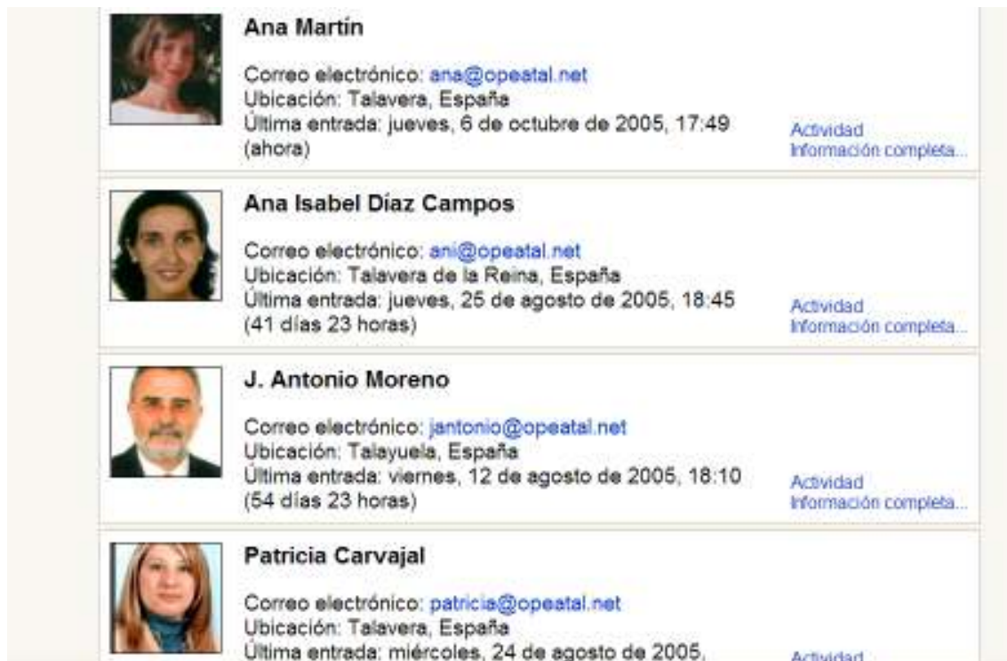
Gráfico 1.9.- Los formadores del curso "Formador Ocupacional".

Desde nuestro centro de formación, los formadores (gráfico 1.9) hemos detectado, a lo largo de los años y a través de la observación y la evaluación del trabajo diario, que los docentes presentan dificultades, temores, miedos, etc cuando tienen que trabajar con los recursos TIC; al mismo tiempo, manifiestan interés y prestan atención a cada una de las actividades que presentamos y enseñamos a través de este tipo de medio didáctico. Queremos que los docentes y/o los formadores que realizan acciones formativas, puedan acreditar y estar cualificados en las competencias tecnológicas; las que les van a exigir si desean trabajar en entornos virtuales, además, pretendemos dar un paso más para consolidar, afianzar el uso de los recursos aprendidos: facilitaremos el servicio de instalación de moodle a nuestros alumnos durante un tiempo, para que ellos puedan insertar sus cursos en este espacio. Permitirá, además de la consolidación del aprendizaje del formador, establecer el seguimiento del alumno en las tareas que le exige el acto didáctico.