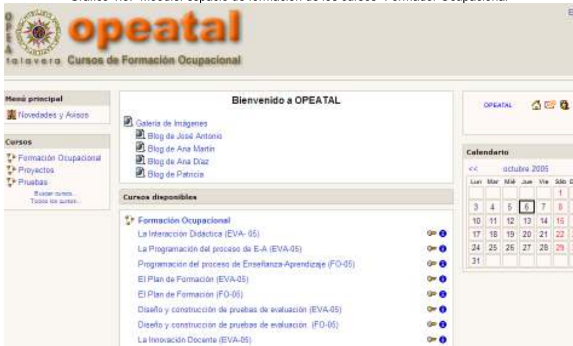
Gráfico 1.8.- Moodle: espacio de formación de los cursos “Formador Ocupacional”

En el desarrollo del acto didáctico, uno de los elementos más importante es el contexto o espacio donde se desarrollan las actividades de enseñanza que diseñan los docentes y las actividades de aprendizaje que realizan los alumnos. Sí el contexto es un espacio virtual, el docente debe realizar las mismas tareas que vienen especificadas en las competencias (planificación, programación, interacción, evaluación e innovación y actualización) pero