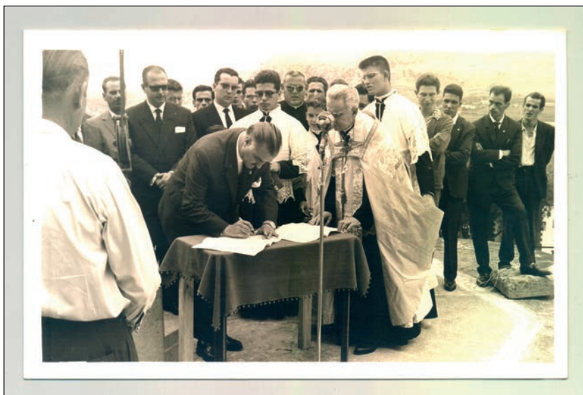
Firma del Alcalde Francisco Ferrera Rosales en el acto de colocación de la primera piedra de la última torre del templo parroquial de San Juan Bautista de Arucas, c. 1962. Fotografía original localizada en los fondos del Archivo Municipal de Arucas. Se desconoce el fotógrafo.