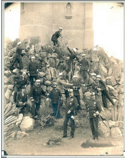
Jardín de la casa de los Marqueses de Arucas, ca. 1894.