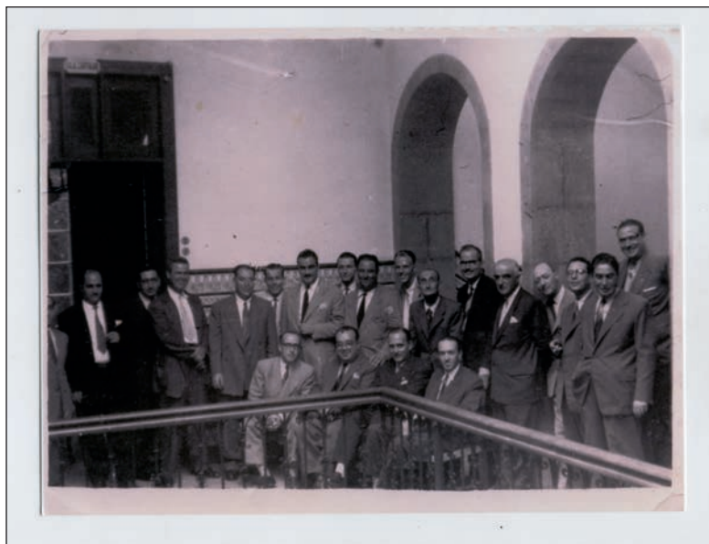
Corporación Municipal, 1952.