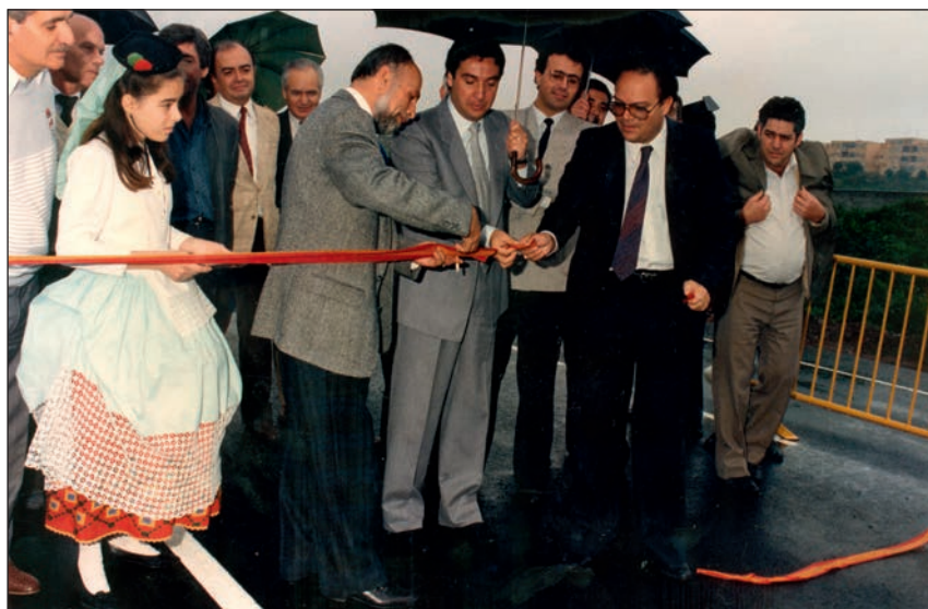
Inauguración y corte de cinta de la autovía de Arucas, enero de 1988.