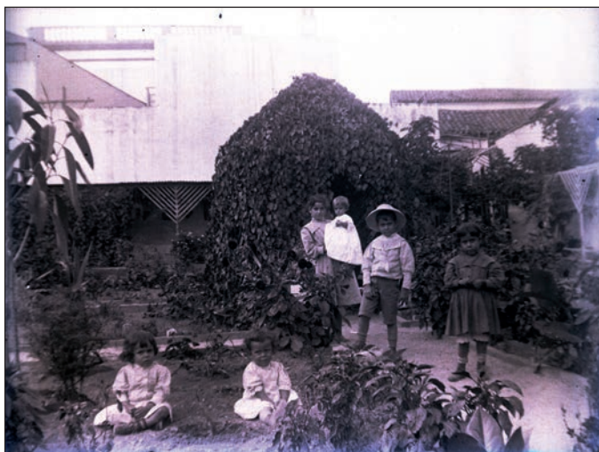
Placa de cristal, finales del siglo XIX. Se desconocen más datos de esta fotografía. Colección localizada en los fondos del Archivo Municipal de Arucas.