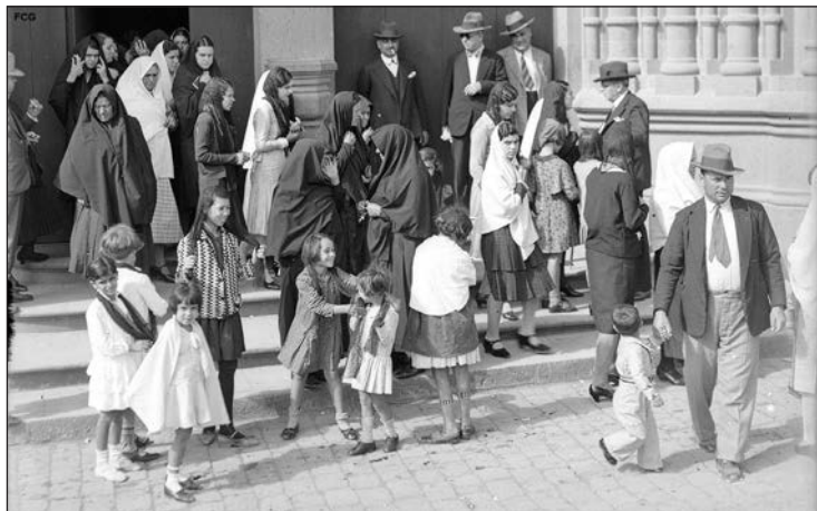
Salida de misa. Iglesia San Juan Bautista de Arucas, ca. 1933. En la imagen se observa a una niña preadolescente con rasgos asiáticos, probablemente se trate de una mujer conocida como «la filipina», que trabajó durante muchos años para una conocida familia propietaria de terrenos agrícolas en la zona de Trasmontaña y Las Chorreras.