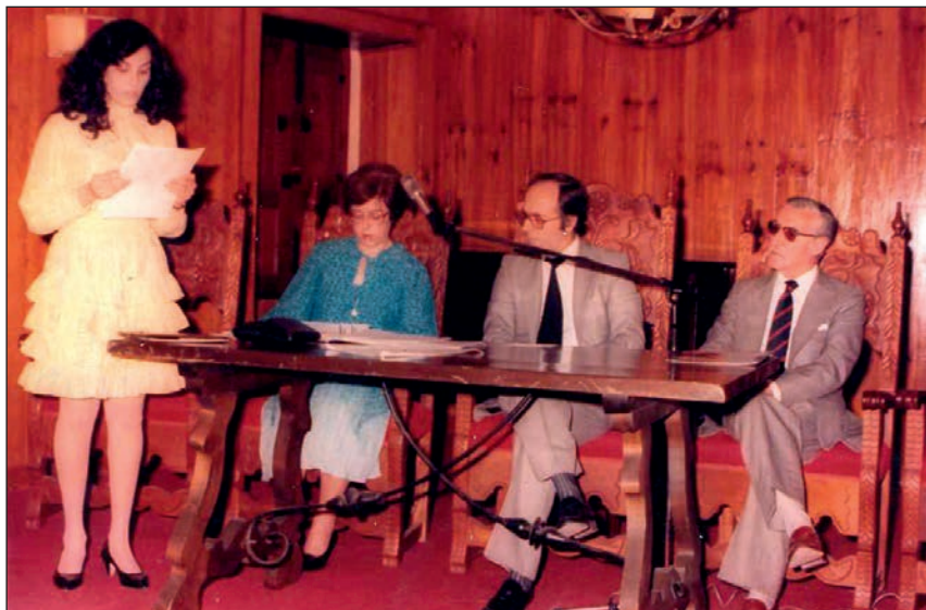
Entrega de premios literarios, salón de actos de la Casa de la Cultura, 1981. Fotografía original localizada en los fondos del Archivo Municipal de Arucas. Se desconoce el fotógrafo.