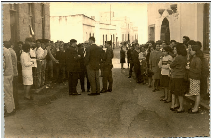
Colas para votar en el referéndum de 1966.