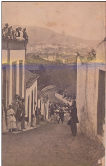
Actual calle Calvo Sotelo, ca. 1868. Probablemente se trate de una de las imágenes más antiguas de Arucas.