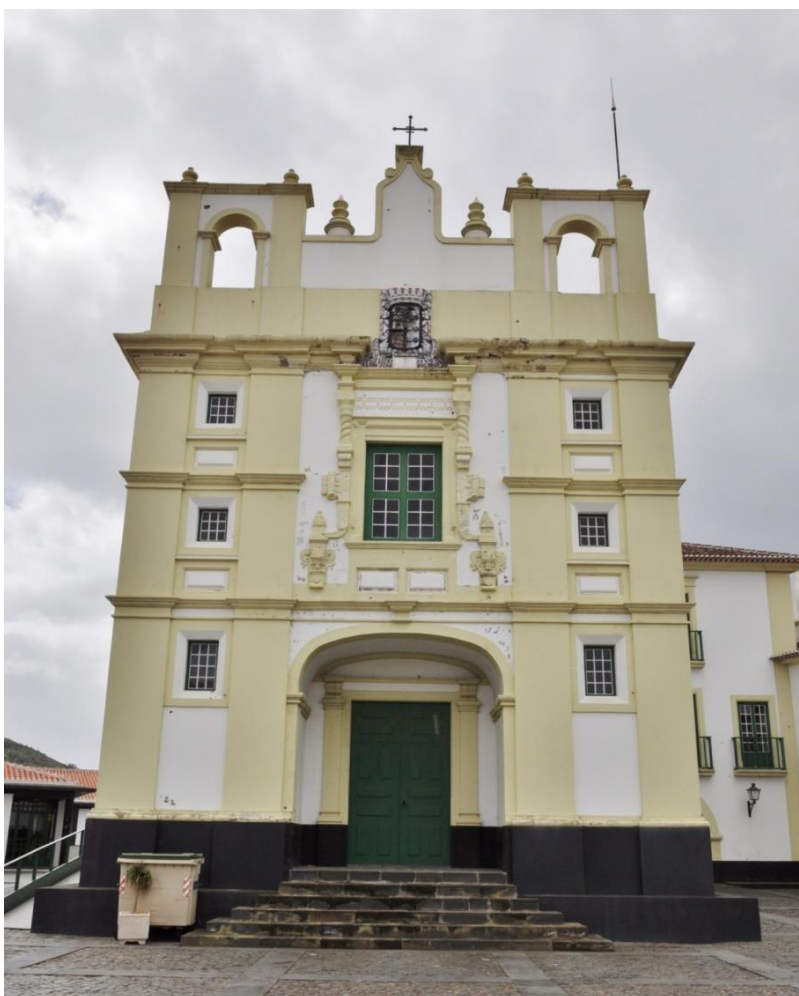
Figura 2 – Aspeto atual da fachada da ermida de Nossa Senhora dos Remédios.