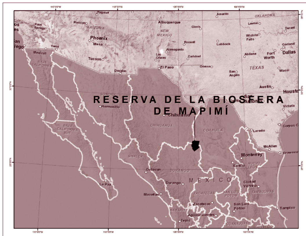
Figura 1. Ubicación geográfica de la reserva.

tanto a funcionarios de la Comisión Nacional de Áreas Naturales Protegidas (Conanp) –organismo de la Secretaría de Manejo de Recursos Naturales (Semarnat)–, como a sus habitantes sobre su perspectiva en torno a la condición actual de la zona protegida, después de cuarenta años de su creación. De las conversaciones sostenidas, se recogió la inquietud –expresada de manera verbal– de poder hacer un balance/recuento de la historia y evolución del manejo de los recursos naturales en la reserva, así como evaluar la efectividad de la modalidad de las reservas sobre el manejo sostenible de dichos recursos, ya que es de todos sabido que en ocasiones se puede generar deterioro ambiental a causa de los visitantes a la reserva (García Gutiérrez, 2006). En estos primeros diálogos participaron seis investigadores, cinco trabajadores de la Conanp y quince ejidatarios.