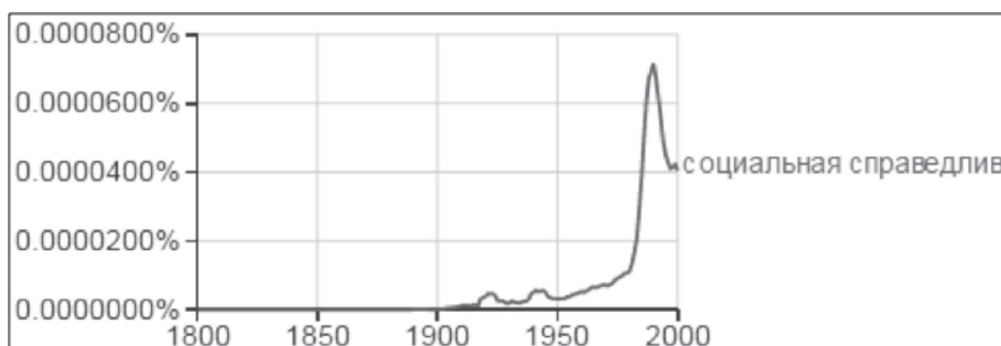
FIGURA 2 FRECUCIA DEL USO DE “JUSTICIA SOCIAL” EN RUSO, SEGÚN GOOGLE NGRAM VIEWER

Por otra parte, la expresión “justicia social” no tuvo amplio uso en la lengua mayoritaria del principal país comunista del siglo xx, la Unión de Repúblicas Socialistas Soviéticas, pues esta idea fue propia de un discurso jurídico-político que estaba en contra del comunismo. Sin embargo, curiosamente, puede verse un tímido ascenso del término durante los años 1920 y 1940, el cual coincide con el surgimiento de documentos importantes en otras partes de Europa que contienen la expresión “justicia social”, según se describió en anteriores etapas. Además, es notable que solo ad portas del colapso de la Unión Soviética y su apertura al bloque capitalista y liberal el término tuvo una tendencia al alza, tendencia que desde algún tiempo se revierte.