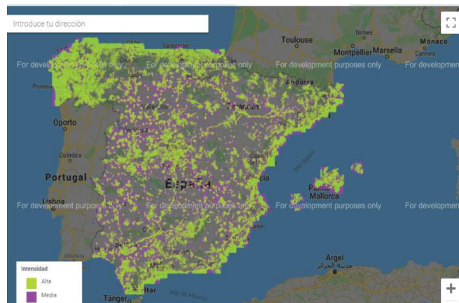
Figura 3. Conectividad de 4G en el territorio nacional.

Una de las principales acciones para frenar la despoblación es reducir la brecha digital, ofreciendo una conexión a Internet, que se extienda a más cantidad de áreas y con mayor calidad. ¿Pero cuál es la situación actual de la conectividad de Internet en zonas rurales? ¿Está llegando un Internet de calidad a todos los rincones de nuestro país? Si se toma con referencia empresas externas, para medir la cantidad y calidad de señal de Internet, se puede ver que la realidad es muy diferente a la que proponen las operadoras en sus campañas publicitarias. La empresa Open Signal® permite explorar mediante un mapa de calor la intensidad de 4G que llega a todas las zonas españolas comprobando que éste llega únicamente a los principales núcleos poblacionales. La importancia del 4G, en ambientes rurales es imprescindible para el desarrollo de la zona, el 4G facilita el autoempleo, el teletrabajo o el ocio en la red. En la Orden ECE/116/2018 (2018) el Estado obliga a las grandes operadoras de telefonía a que antes de que acabe el año 2020 las mencionadas multinacionales tengan que ofrecer un servicio de 30 Mbps de descarga al 90% de los habitantes de municipios menores de 5000 habitantes.