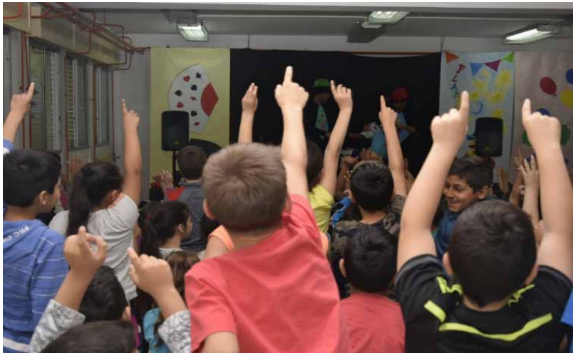
Pedían voluntarios y salían a multitud. Todos deseaban participar y pasarlo bien