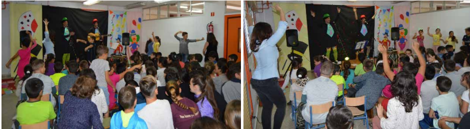
Maestros y alumnado bailaron cada una de las canciones