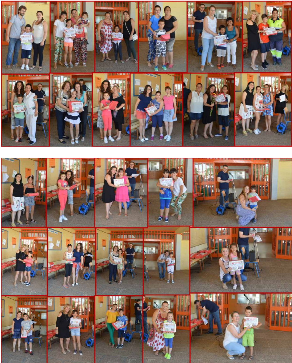
Entrega de premios al alumnado