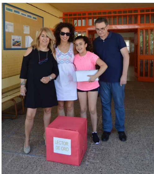
Entrega de premios a las familias