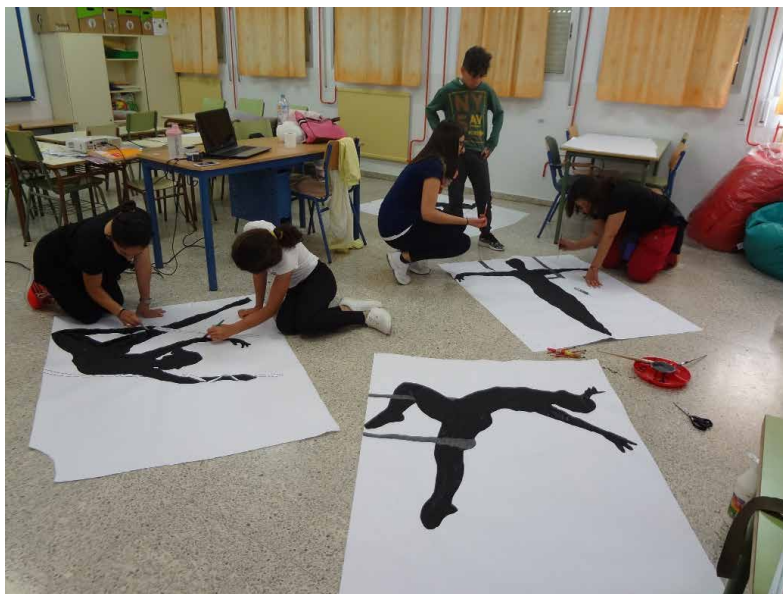
Colocación de cada una de las figuras