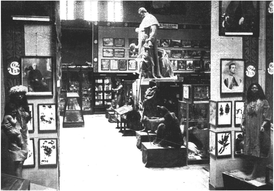
Figura 2. Mirada hacia la sala de América meridional.