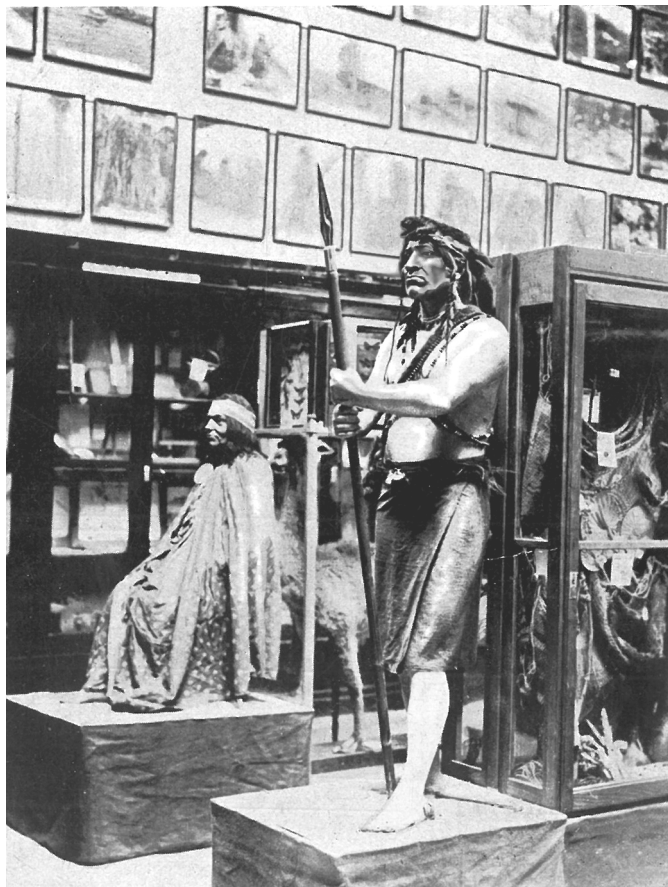
Figura 3. Misiones entre los jíbaros de Ecuador.