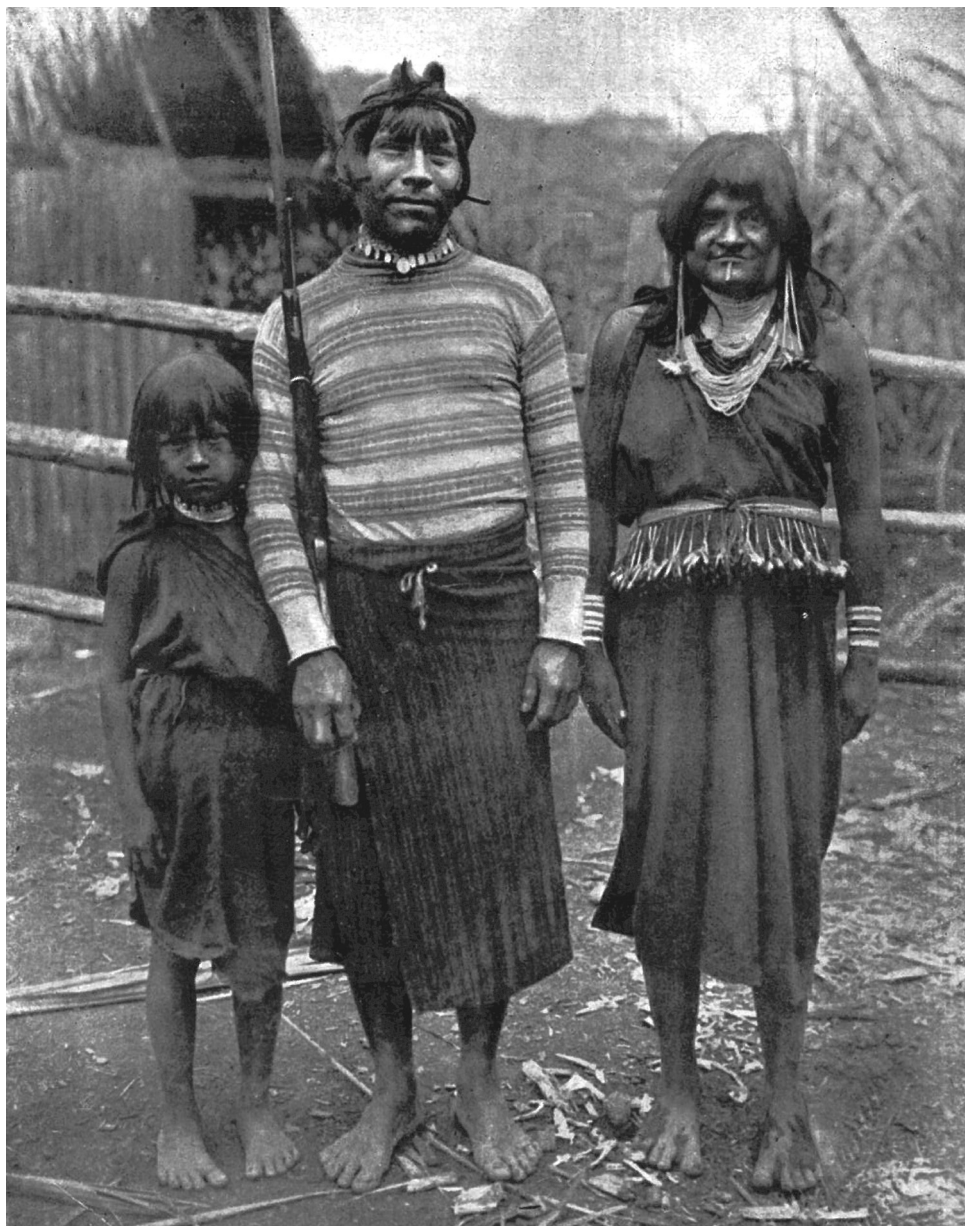
Figura 5. Las primicias del Apostolado: Giovanni Bosco con su familia.