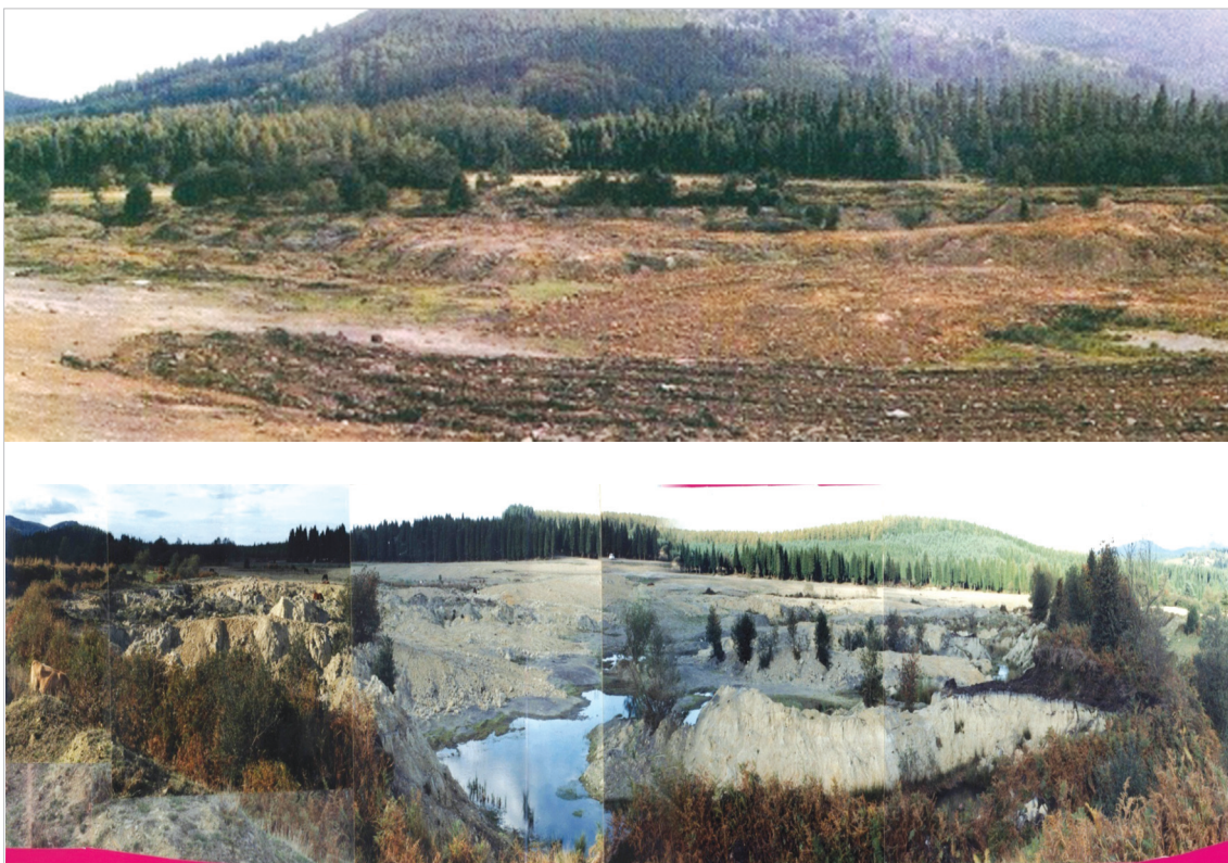
Figura 1. Estado de los terrenos a restaurar tras el cese de la explotación de la Turbera de Saldropo (1990). Al fondo en la fotografía superior, la “ceja de turba”.

primeras medidas de restauración del lugar. Ya para entonces se observaba una primera colonización de las balsas, principalmente por juncos ( Juncus effusus ) espadañas ( Typha latifolia ) y platanarias ( Sparganium erectum ) (fig. 2).