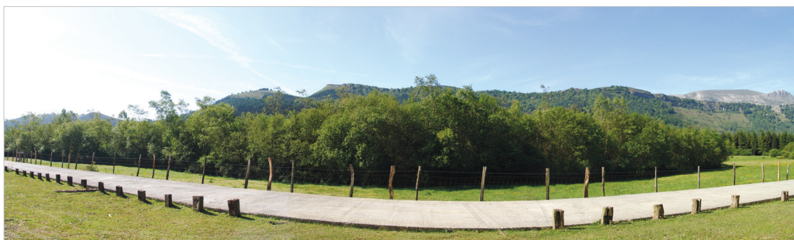
Figura 3. Aspecto boscoso del Humedal de Saldropo en 2014.