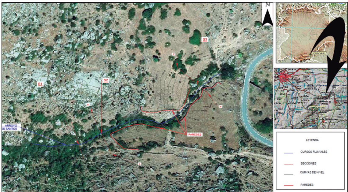
Figura 1. Localización de la zona de actuación así como las diferentes secciones propuestas para la situación de los diques forestales en el arroyo de Los Santos.

En este trabajo se expone una metodología centrada en la determinación de los aspectos clave para un diseño de varias obras hidráulicas dentro de la misma cuenca. Se exponen los pasos clave para el diseño real y eficaz de acuerdo a la consecución de los objetivos establecidos.