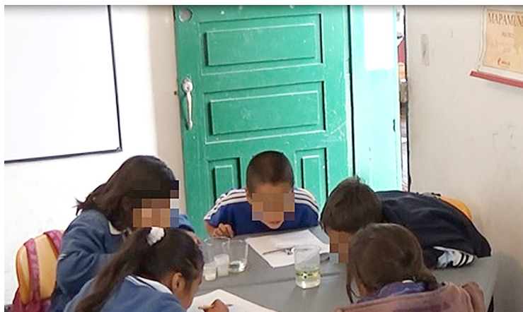
Figura 1. Grupo de trabajo de 2° grado en experiencia Conozcamos los líquidos .

Al respecto Driver, Squires, Rushworth y Wood-Robinson (1994) indican que los niños pueden asociar ideas previas desde términos como el más pesado, el más liviano a concepto de masa, volumen y densidad , contruidos desde vivencias cotidianas con los materiales e interacciones sociales.