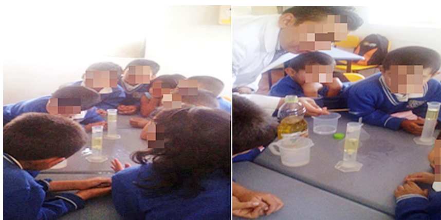
Figura 6. Grupo de estudiantes 2° grado en desarrollo de experiencia El curioso caso de la flotación .

medida que se avanza en el desarrollo de los experimentos, van acercándose al uso del concepto científico, en este caso el concepto de densidad . Una inferencia adecuada es la de Estefanía, en la línea 5, quien explica que la densidad de los líquidos es independiente del uso de las puntillas. Esta perspectiva es interesante porque demuestra cómo los estudiantes hacen asociaciones al cambiar las condiciones iniciales del experimento, las cuales permiten que los estudiantes tengan un aprendizaje más estructural de los conceptos de ciencias.