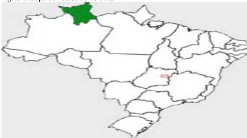
Figura 1: Mapa do Estado de Roraima.