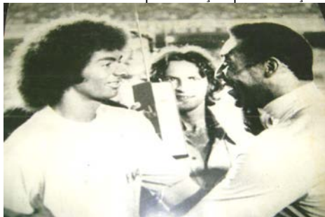
Figura 2 - Assis Paraíba em apresentação pela Seleção Brasileira.