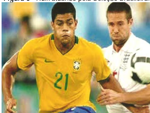
Figura 8 - Hulk atuando pela Seleção Brasileira.

O resultado da valorização do atleta veio rápido e a cláusula de rescisão que antes estava fixada em R$ 40 milhões subiu para R$ 100 milhões, considerada a mais alta da história futebol português. A sua cotação subiu rapidamente em um ano, tornando-o numa das estrelas do futebol europeu em parte devido à campanha do clube na Liga dos Campeões 2009-2010. A temporada de 2010/2011 o atleta começou em plena forma, marcando dezesseis gols nos primeiros dezesseis jogos em que atuou.