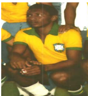
Figura 1 - Atleta Índio na Seleção Brasileira.

de seus familiares sem, contudo, deixar de jogar suas peladas. A fisionomia indígena deu-lhe o apelido que o tornaria reconhecido para o resto da vida: Índio.