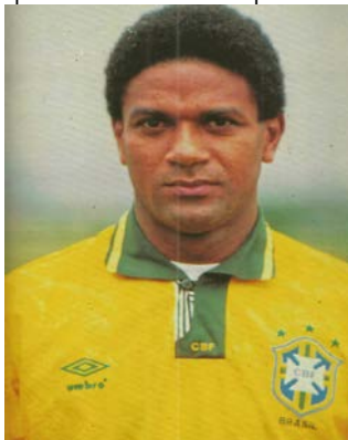
Figura 5 - Mazinho Campeão do Mundo na Copa de 1994, nos Estados Unidos.

Revelado pela equipe do Santa Cruz da cidade de Santa Rita - PB, na década de 80, onde atuava como lateral esquerdo, Mazinho passou pela Seleção Paraibana Júnior e com 16 anos se transferiu para o Vasco da Gama, onde impressionava pela sua versatilidade, tendo por isso se destacado e conquistado vários títulos, fato que contribuiu para sua saída para o futebol europeu, onde fez bastante sucesso.