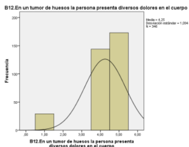
Gráfico 2: B12

O.E.2.-Mostrar los conocimientos docentes sobre tumor en los huesos en la etapa de primaria