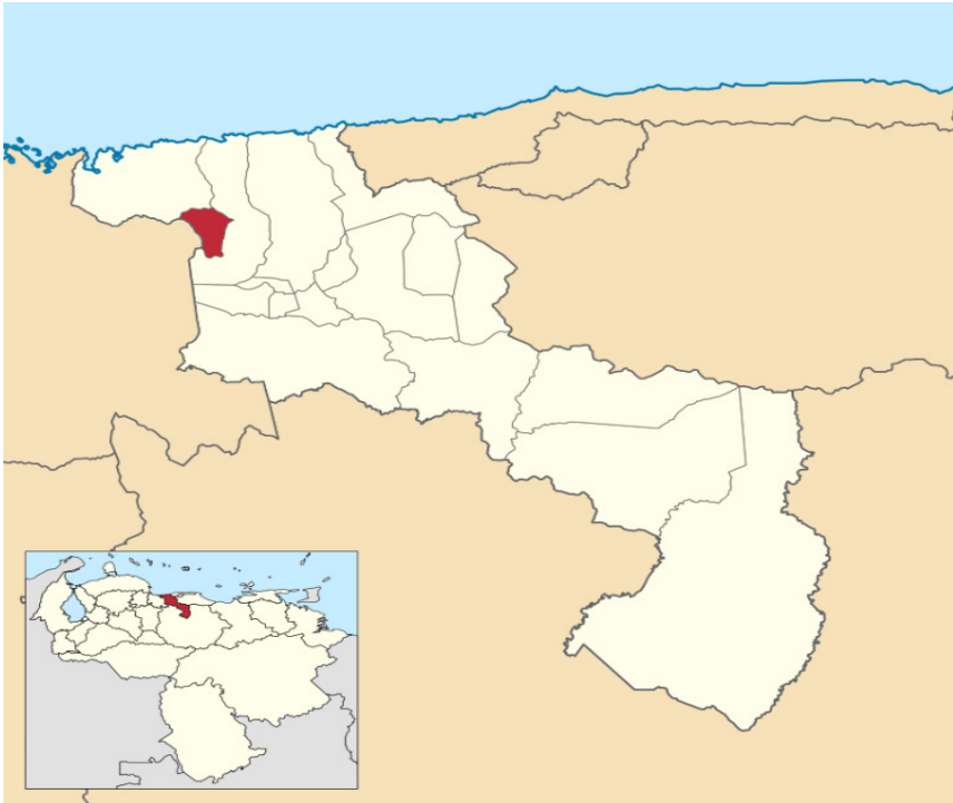
Figura N° 1: Ubicación geográfica del Municipio Mario Briceño Iragorry, Estado Aragua, Venezuela.