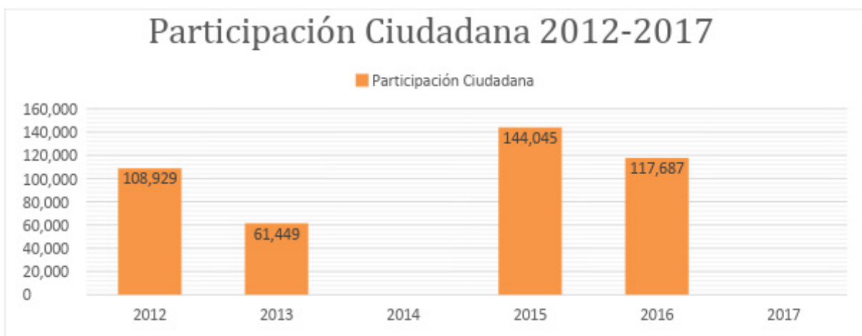
Figura 3. Participación ciudadana en asambleas barriales 2012-2017

Fuente: elaboración propia con datos de la Secretaría de Participación 1 .