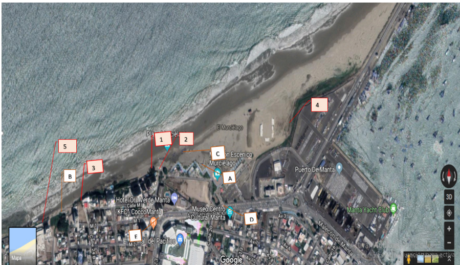
Figura 2. Diciembre, 2017. Distribución de hotspots en el mapa y su leyenda. Rosado: hotspots saturados. Café claro: no saturados pero que, en conjunto, inciden en dinámicas.