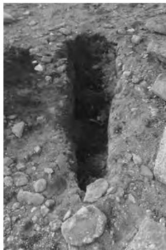
Lám. 4. Sepulcro antropomorfo de “La Almena”.