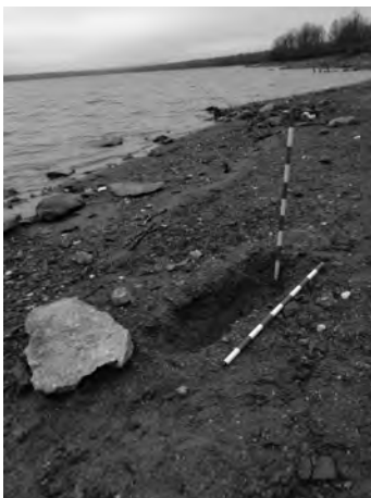
Lám. 3. Tumba de “La Almena”.

Las sepulturas están agrupadas en la ladera que baja suavemente de “El Castellote” hacia el sur. El conjunto funerario constituye una necrópolis, probablemente ligada a un posible emplazamiento humano en dicho lugar. Los enterramientos están orientadas al este y cubiertas por lajas de gneis (entre 3 y 4). De hecho en el lugar se observan varias de estas lajas, presuntamente removidas en tiempos muy recientes (en el segundo semestre de 2017). Una inspección ocular detallada en el lugar sugiere la existencia de otras tumbas, presumiblemente intactas, pues se observan las piedras o lajas de cubierta dispuestas horizontalmente sobre el suelo; de ahí que, de cara a documentarlas correctamente, sería conveniente realizar excavaciones arqueológicas en momentos en que el nivel de las aguas lo permita.