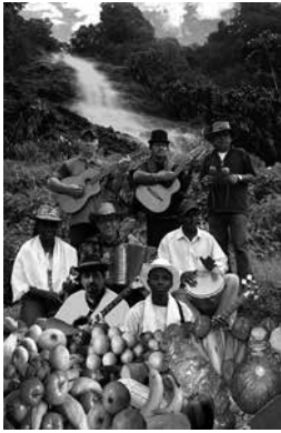
Imagen 1. Grupo Campo y Sabor.

ción Agropecuaria (CIPAV), el Instituto Mayor Campesino de Buga (IMCA) y la Corporación Autónoma Regional del Valle del Cauca (CVC). 1