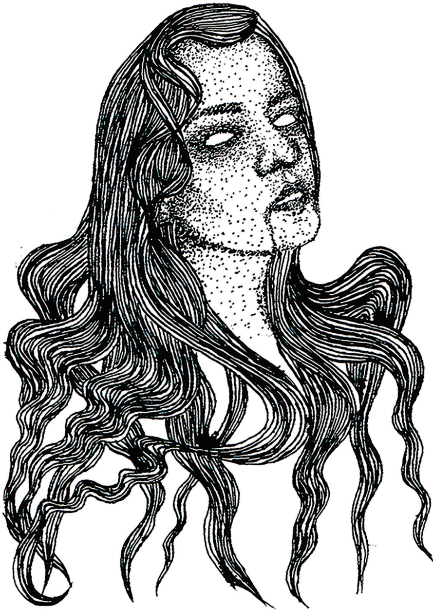
Witch (2018). Tinta china sobre papel de algodón. Larvae (Anel Martínez). Prohibida su reproducción en obras derivadas.