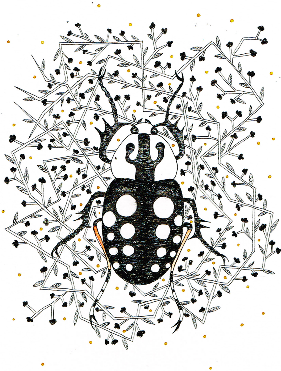
White beetle (2018). Tinta china sobre papel de algodón: Larvae (Anel Martínez). Prohibida su reproducción en obras derivadas.