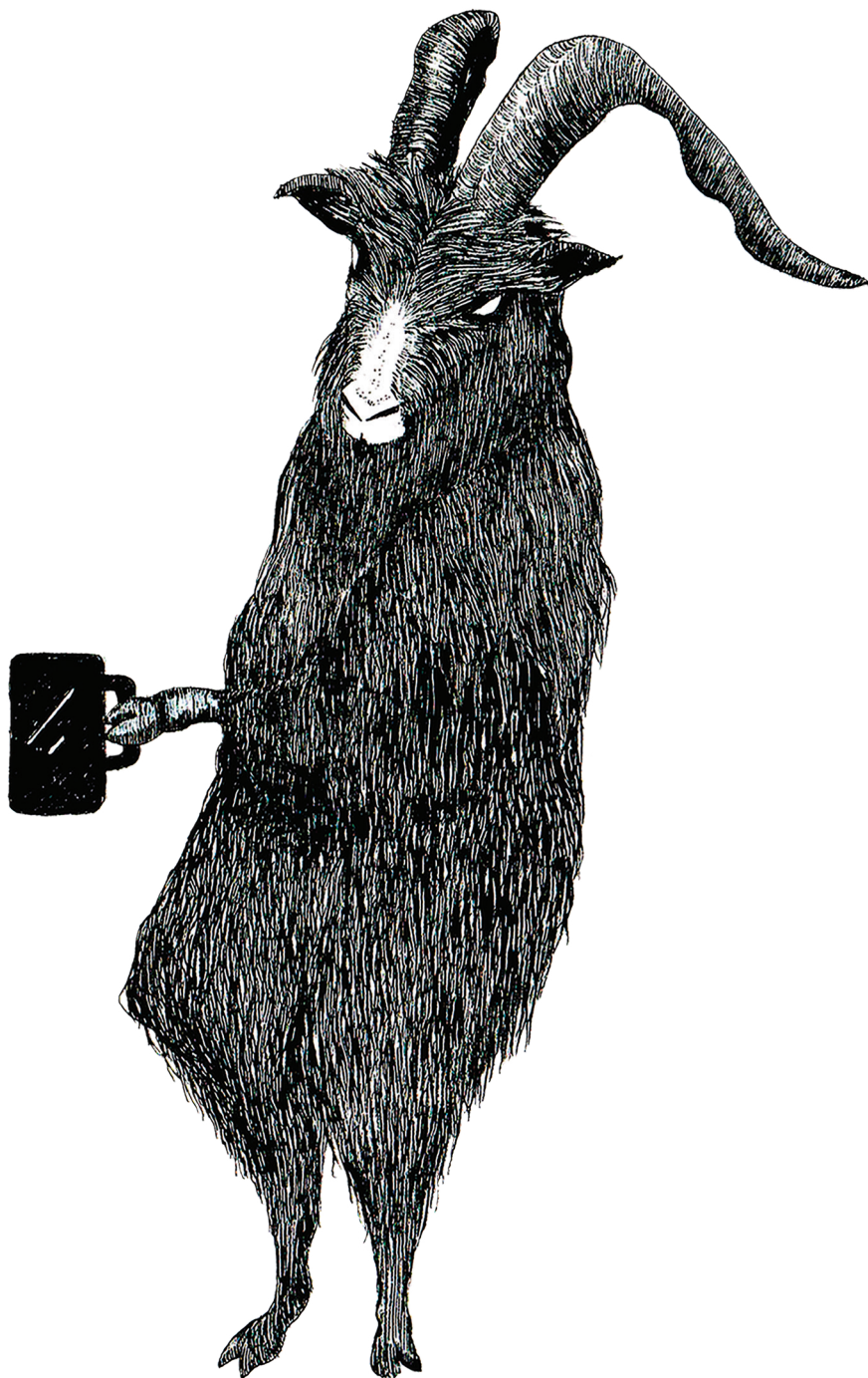
Hello Black Phillip (2018). Tinta china sobre papel de algodón: Larvae (Anel Martínez). Prohibida su reproducción en obras derivadas.