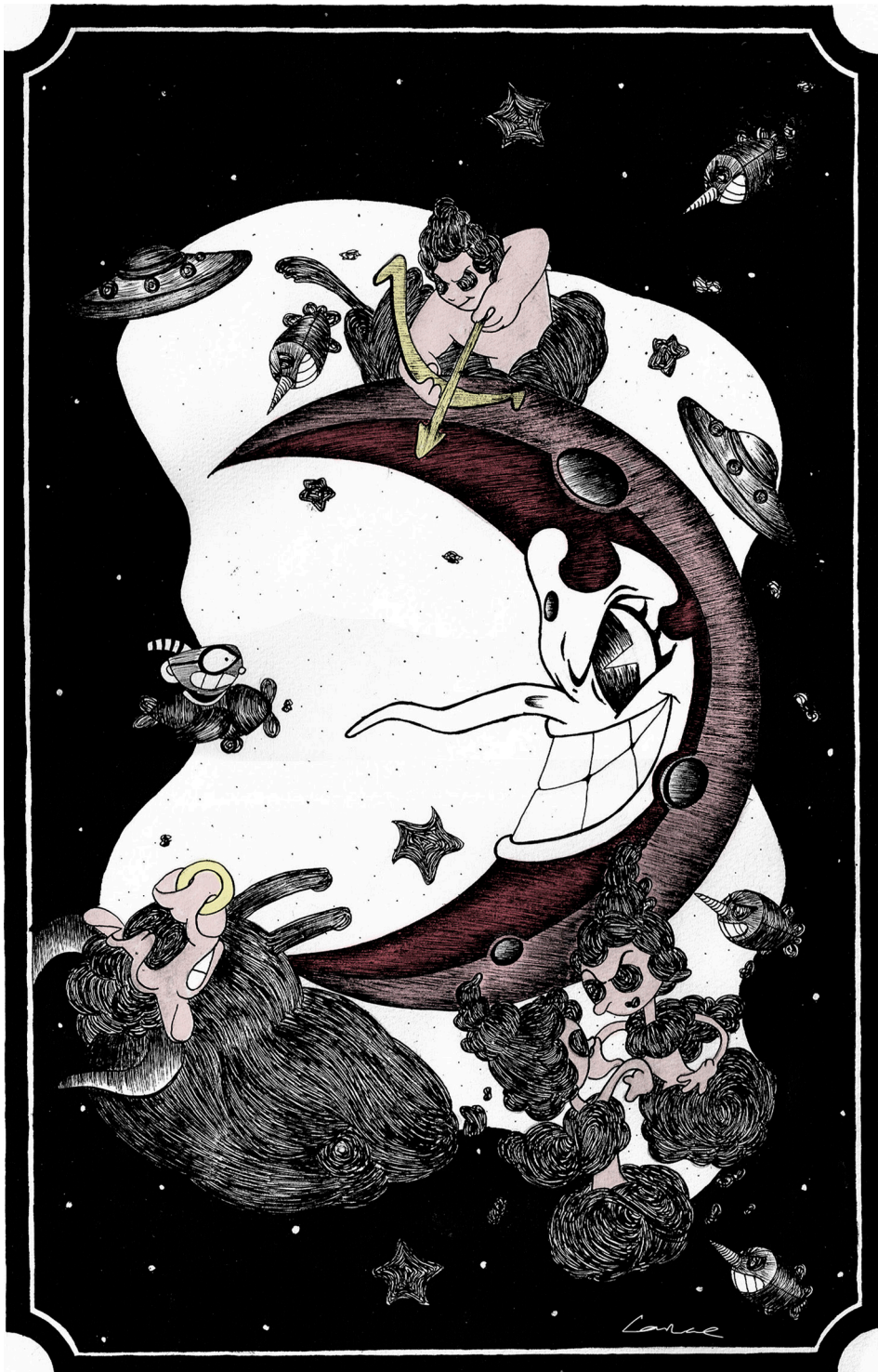
FanArt Cuphead (2017). Tinta china sobre papel de algodón: Larvae (Anel Martínez). Prohibida su reproducción en obras derivadas.