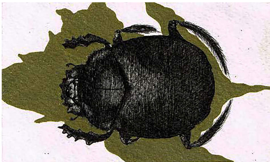
Terra (2017). Tinta china sobre papel de algodón: Larvae (Anel Martínez). Prohibida su reproducción en obras derivadas.