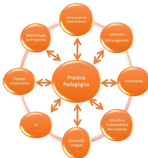
Figura 1. Ejes esenciales de la Práctica socioformativa.

Desde el enfoque socioformativo, o considerando la sociedad del conocimiento, se propone definir el concepto de práctica pedagógica como: el conjunto de actividades orientadas y reflexionadas por el docente para generar conocimientos que favorezcan el desarrollo integral de los estudiantes y éstos, sean aptos para enfrentar los problemas del contexto a través de metodologías que propicien el trabajo colaborativo, apoyados con las TIC, con el fin de alcanzar las competencias establecidas en la currícula.