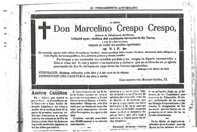
Esquela de uno de los fallecidos en el accidente. El Pensamiento Astorgano .

Por ende, debemos aclarar quién era este personaje y cuáles fueron sus actividades desde que pisó suelo español. Nacido en Escocia, había cursado estudios de agronomía, topografía y minería antes del estallido de la Gran Guerra, habiéndose alistado como soldado en diciembre de 1915; solicitando un año más tarde su traslado a los Royal Engineers , sirviendo como tal en Francia donde obtendría el rango de teniente en 1917. Se licenció en febrero de 1919, conservando sus galones de oficial, pero con la categoría de ingeniero civil 55 : consta que en 1924 solicitaría un empleo de funcionario colonial, no obteniéndolo, pues tres años después lo encontramos trabajando como ingeniero jefe en la provincia de Soria, en la construcción de la línea férrea Santander-Mediterráneo 56 . Tres años más tarde, este profesional se hallaba en la ciudad de Melilla, participando en las obras de mejora del puerto melillense 57 . Por entonces era una per-