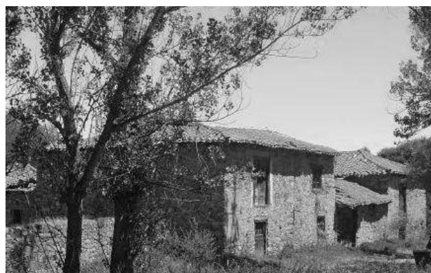
Casa-palacio de los condes de Catres, señores de Valdemagaz, en Benamarías, la Cepeda (León).