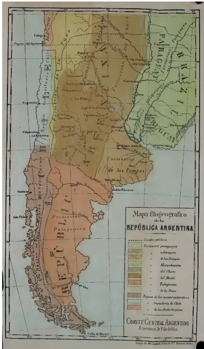
Figura 3. Mapa fitogeográfico de la República Argentina. Mapa elaborado por el Comité Central Argentino

Nota. Mapa elaborado a pedido del Estado Nacional para la Exposición de Filadelfia.