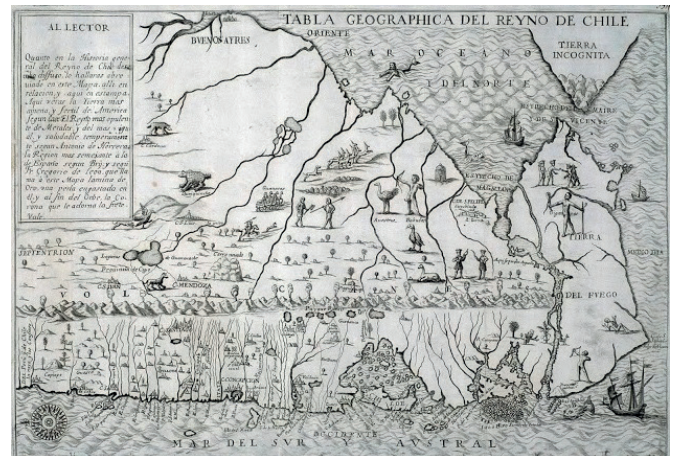
Figura 1. Tabula Geographica Regni Chile. Alonso de Ovalle, 1646