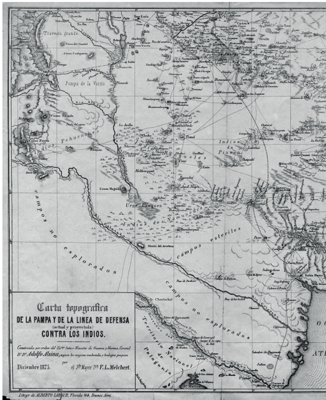
Figura 2. La Pampa y la línea de defensa contra los Indios. Mapa elaborado por F. L. Melchert

En la primera mitad del siglo XIX, los distintos gobiernos criollos asignaron a este espacio “un papel marginal, fronterizo, en la dialéctica del desarrollo de las fuerzas productivas del área central pampeana” (Navarro Floria, 1994: 17). Durante el proceso independentista a inicios del siglo XIX, para las Provincias Unidas del Río de la Plata, la Patagonia continuaba siendo denominado como un territorio bajo el dominio indígena (Figura 2 y Figura 3). En esa etapa las modificaciones jurisdiccionales eclesiásticas se produjeron en los territorios del norte con la creación de diócesis y obispados. La Patagonia siguió integrada a Buenos Aires sin reconocer poblamientos que demandaran otro tipo de jurisdicción (Figura 4).