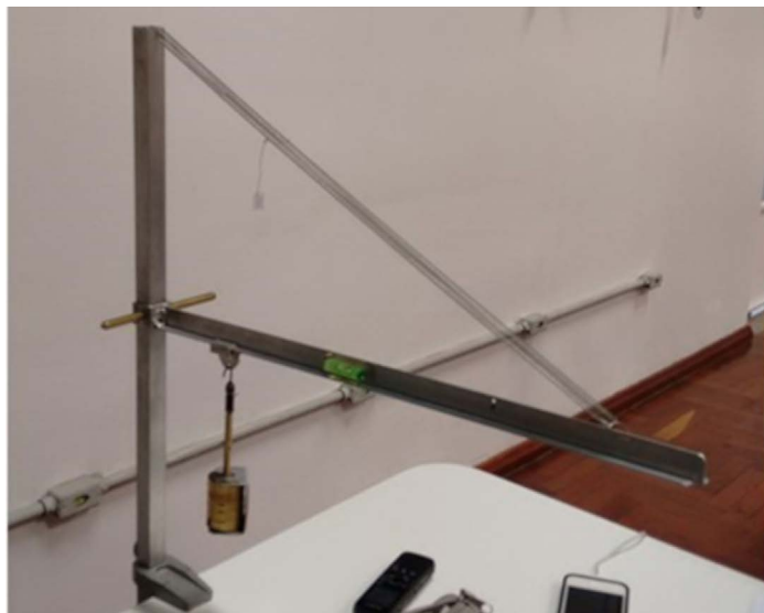
Figura 1 – Haste em equilíbrio