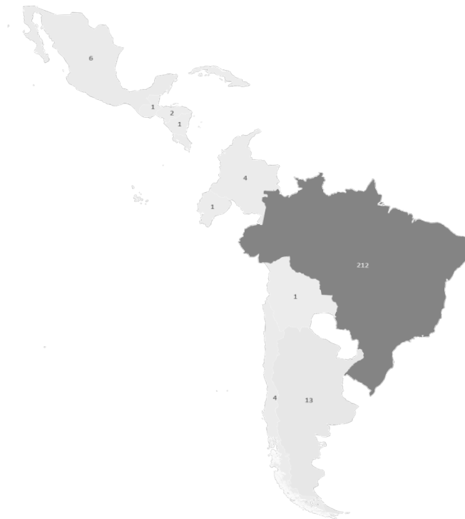
Figura 3. Distribución geográfica de las publicaciones.