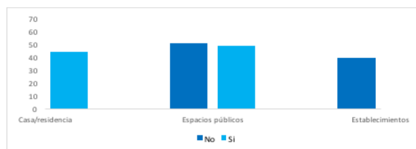
Gráfico 2. Barreras

En los espacios públicos la calle fue reportada con mayor presencia de barreras, seguido de los andenes y los vehículos de transporte público, 37.5% , 29.2% y 29% respectivamente; y en menor medida las barreras en los centros educativos, no obstante, hay que tener en cuenta que la mayoría de la población registrada corresponde a personas mayores de 63 años y es en esta edad donde disminuye la asistencia según el reporte del DANE en el 2008 “a partir de los 14 años la asistencia escolar disminuye en forma importante y conforme aumenta la edad” . (DANE, 2008)