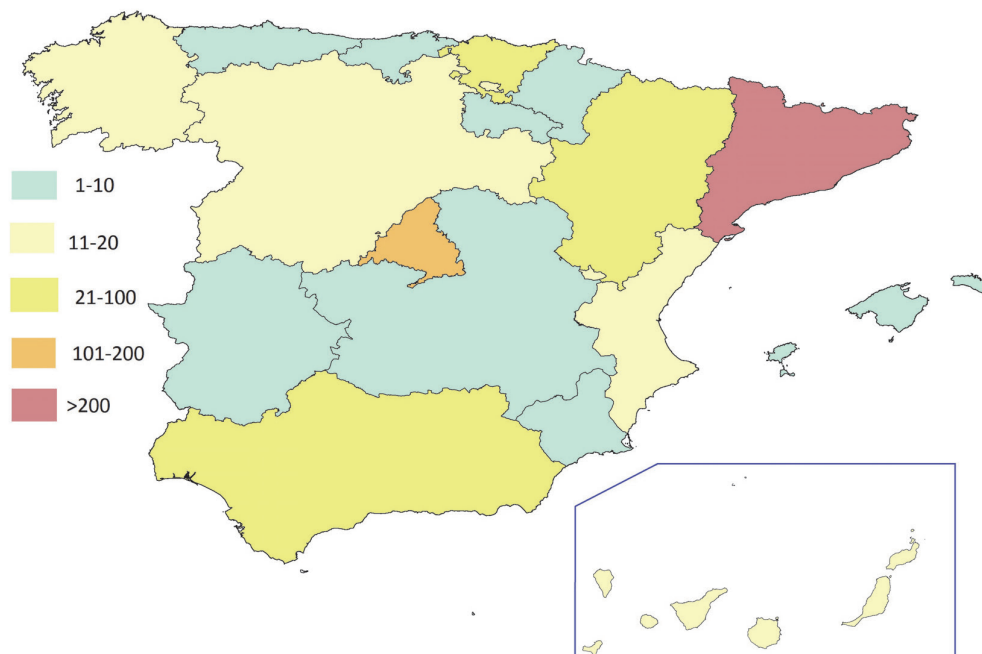
Figura 3 Casos de enfermedad por virus Zika declarados por Comunidad Autónoma hasta diciembre de 2017