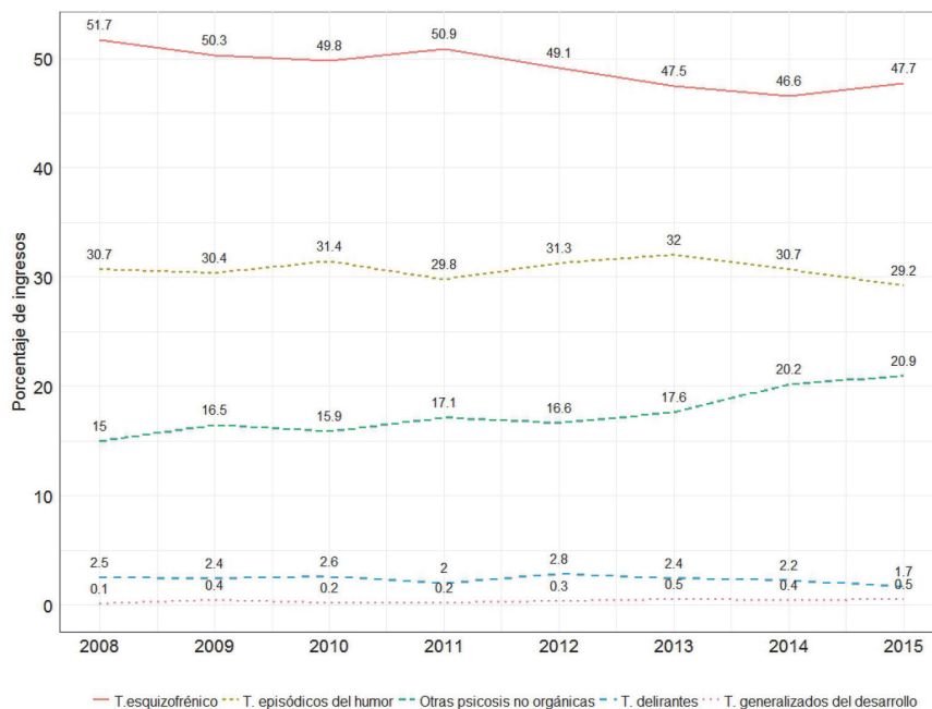
Figura 1 Distribución temporal de los porcentajes de ingresos por categorías diagnósticas

Al estratificar por el sexo, se observaron diferencias respecto al diagnóstico principal ( p < 0,001 ), siendo más frecuentes en hombres los trastornos esquizofrénicos, mientras que en las mujeres fueron los trastornos episódicos del humor (ver tabla 2 ).