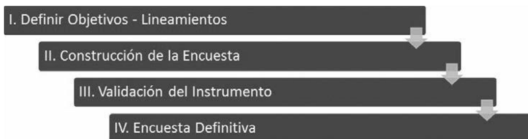
FIGURA 3. Esquema de ponderaciones de sub-dimensiones y variables.

El proceso consta de cuatro pasos: en el primero se definen los lineamientos (motivos) que formularán la encuesta; luego se construye cada cuestionario (encuesta); el tercer paso es la validación de cada instrumento con el fin de consolidar el cuestionario definitivo; finalmente, se obtiene la encuesta definitiva (figura 3).