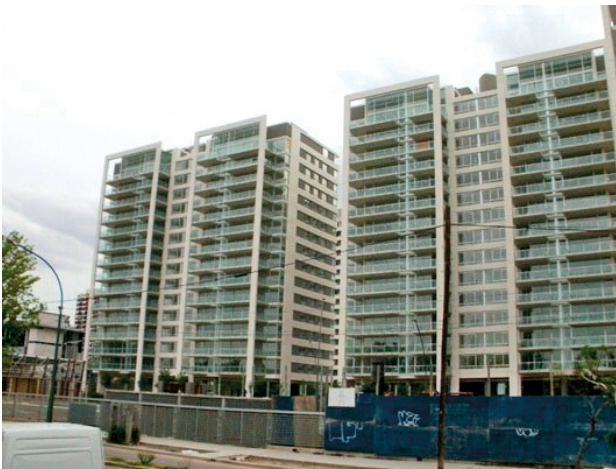
Figura 4. Torres Horizons , de la empresa IRSA.

IRSA anunció la construcción en esos terrenos del fastuoso proyecto residencial Horizons : un conjunto de seis torres a la vera del río (Figura 4), con perímetro parquizado, piscina, seguridad y amenidades de lujo. Antes de comenzar las obras, en junio de ese año, Horizons ya tenía 300 compradores a un precio de entre US$2.400 y US$3.000 el metro cuadrado ( Diario La Nación 2008). Es decir, al comercializar las parcelas fraccionadas bajo los nuevos criterios urbanísticos, en un lapso de cuatro años, la empresa multiplicó por siete el valor de la propiedad. Lo que se produjo fue un proceso de “especulación inducida” (Jaramillo González 2009) por actores con gran poder financiero y de presión política, que se dedicaron a comprar terrenos por precios que respondían a bajas densidades y —tras lograr modificar los coeficientes constructivos— edificaron y vendieron las propiedades a precios ampliamente superiores.