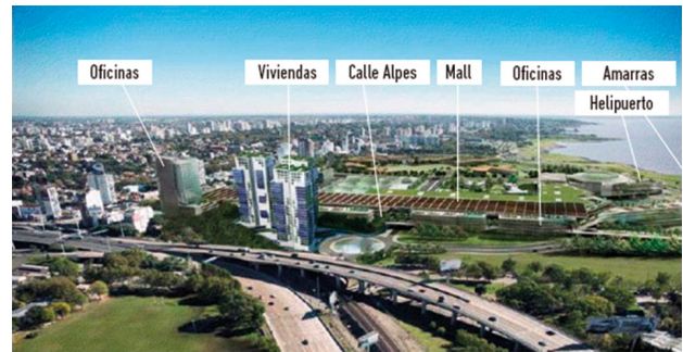
Figura 3. Render del Proyecto Al Río.

tres empresas asociadas —junto a reconocidos estudios de arquitectura— concibieron el proyecto “Al Río”.