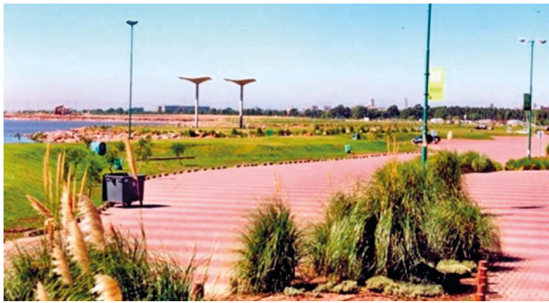
Figura 2. Paseo de la Costa de Vicente López, previo a la construcción del Vial Costero.

La propuesta para desarrollar un paseo costero en Vicente López se remonta a la década de los noventa, cuando el Concejo Deliberante sancionó una ordenanza para la “Recuperación Urbana Ambiental y Ecológica de la Costa Ribereña”. Una década más tarde, en 2004, se finalizó la “recuperación” de la costa del Río de la Plata. El resultado final fue un paseo costero erigido sobre tierras de rellenos, formados con restos de demolición y volcados ilegales, que se fueron haciendo en el transcurso de la década de los ochenta. Este se llamó Paseo de la Costa (Figura 2). De traza paralela a la avenida Libertador, el Paseo de la Costa contaba con un auditorio, instalaciones deportivas, recreativas, y un amplio parque paralelo al corredor principal (Christel y Wertheimer 2010).