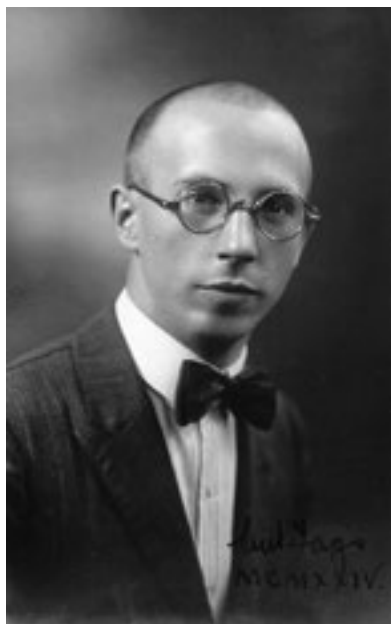
Autorretrato. 1924, BLANCO PASCUAL

En 1919 asina importantes imaxes de carácter etnográfico e paisaxístico: o ambiente da feira na praza Maior, os carpinteiros, as lavandeiras e as bei-