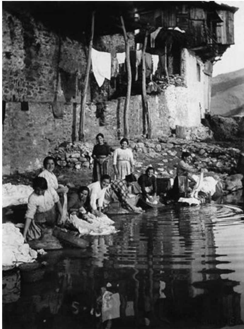
Lavadeiras. 1919. BLANCO PASCUAL