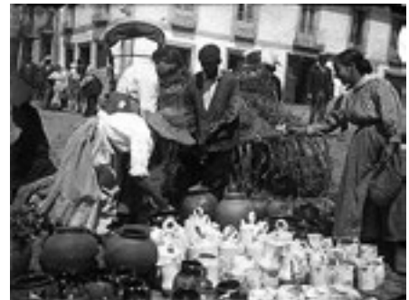
Oleiros maragatos na feira da Praza Maior. c.1916.