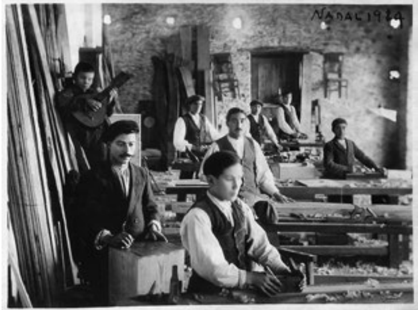
Taller de carpintería. 1919.