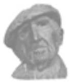
Cos alumnos do Instituto da Estrada catalogou os xacementos arqueolóxicos da comarca, entre 1933 e 1936.