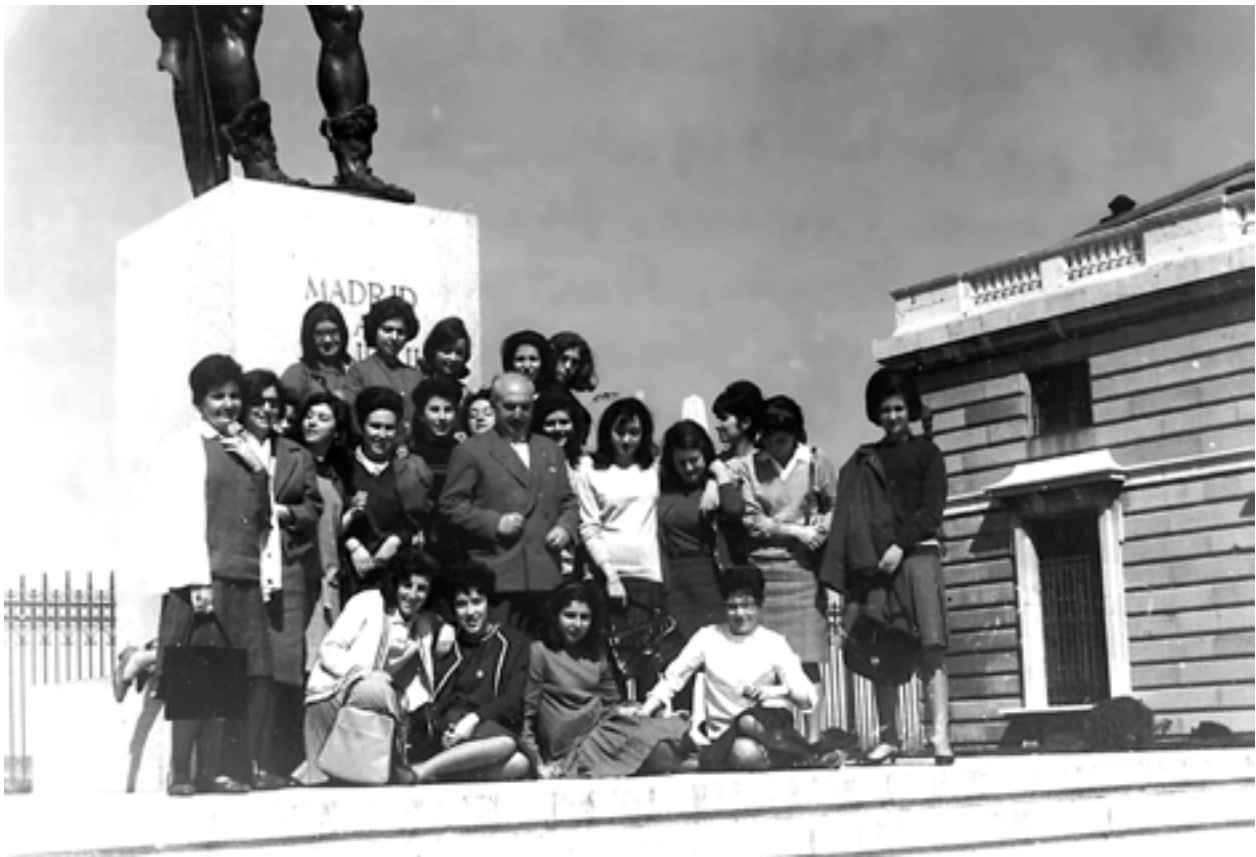
Excursión a Madrid coas alumnas de 6º curso do Instituto Feminino de Santiago (1963)