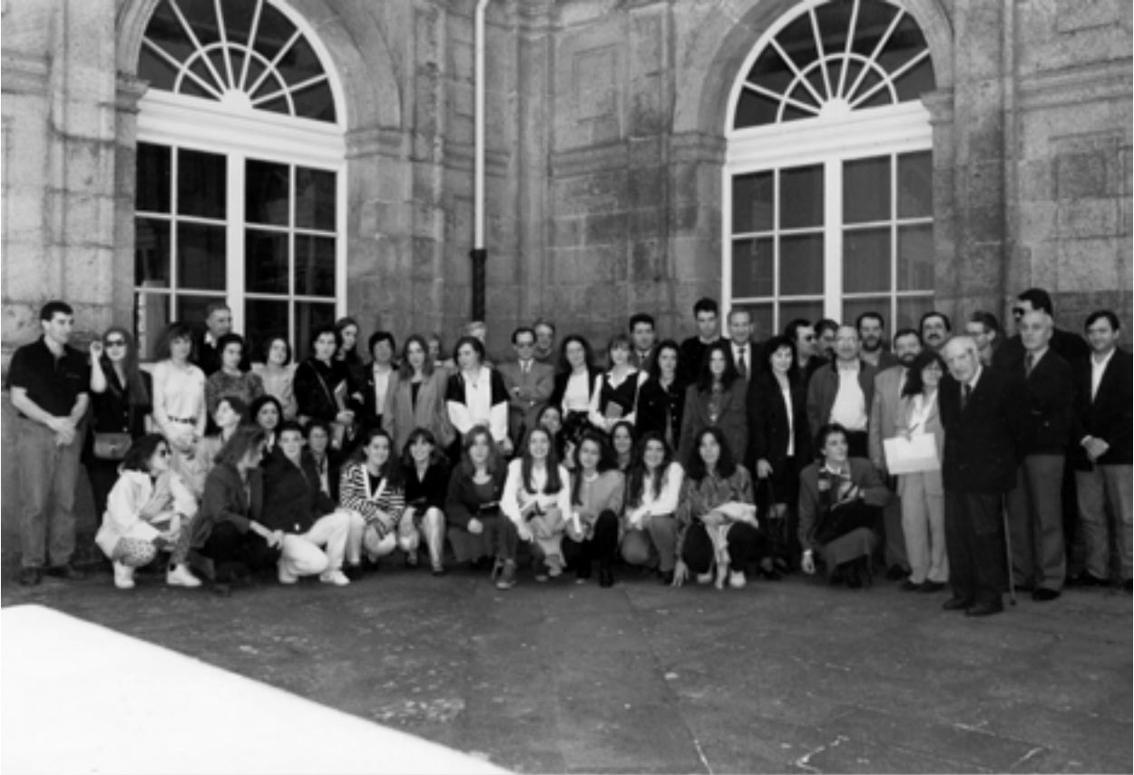
No patio do Instituto "Rosalia de Castro", rodeado de profesores e alumnos, nunha das súas últimas visitas

vendo os cargos de vicesecretario, secretario e xefe de estudos. Asemade, participa de xeito activo na vida cultural lucense.