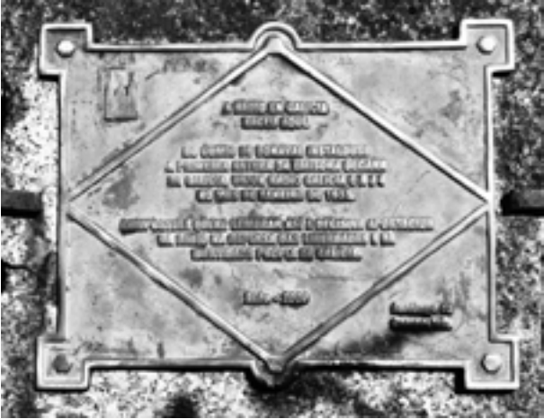
Placa no parque compostelán de San Domingos de Bonaval dando fe de que a radio en Galicia “naceu aquí”