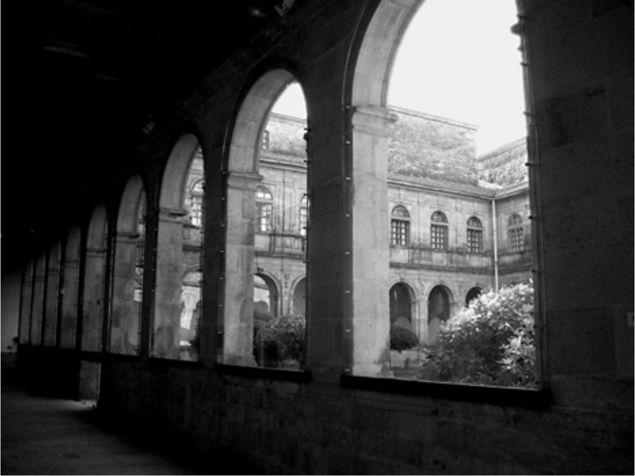
San Domingos de Bonaval, Museo do Pobo Galego: o claustro