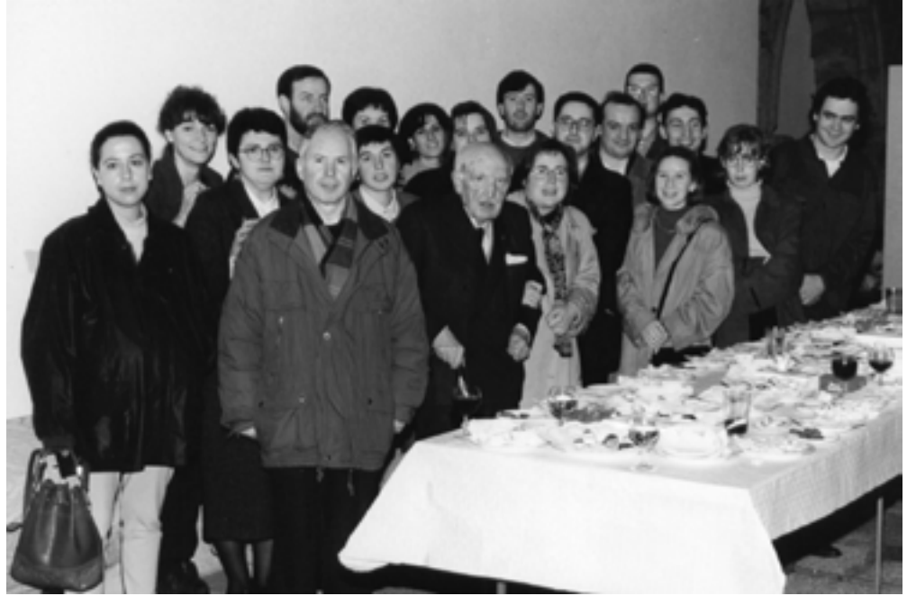
Don Antonio co persoal e colaboradores do Museo

como homenaxe a algúns dos seus máis queridos amigos: