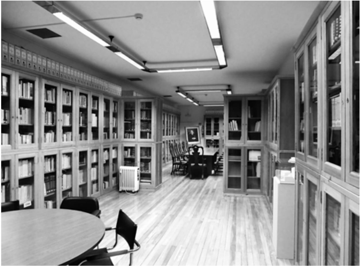
Museo do Pobo Galego: A biblioteca de Antonio Fraguas

determinada materia, compañeiros de traballo ou colegas doutros países, e de moita xente que apenas traxeron con el un par de horas ou escoitouno nunha conferencia pero que quedaron prendidos da súa entrañable forma de ser.