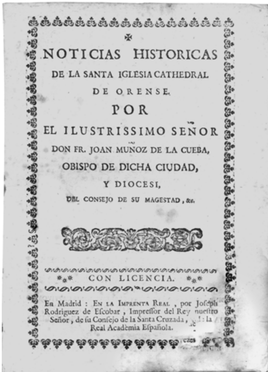
J. Muñoz de la Cueva: Noticias históricas de la Santa Iglesia Cathedral de Orense..., Madrid (1727?) (MPG: Biblioteca de A. Fraguas)