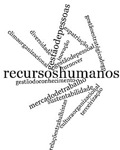
Figura 3 – Palavras-chaves mais citadas no contexto brasileiro