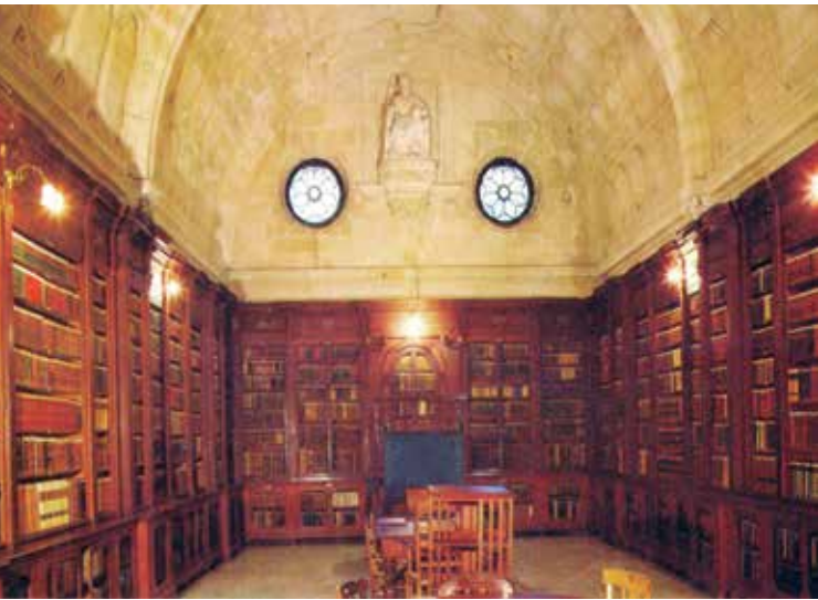
Antigua sala de la biblioteca.