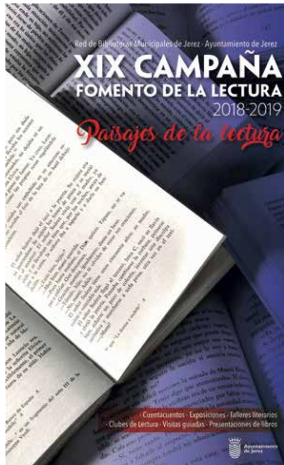
Cartel de la campaña 2018-2019.

También la incorporación de la Biblioteca Central y sus centros dependientes al Catálogo Colectivo Andaluz en internet la hacen una