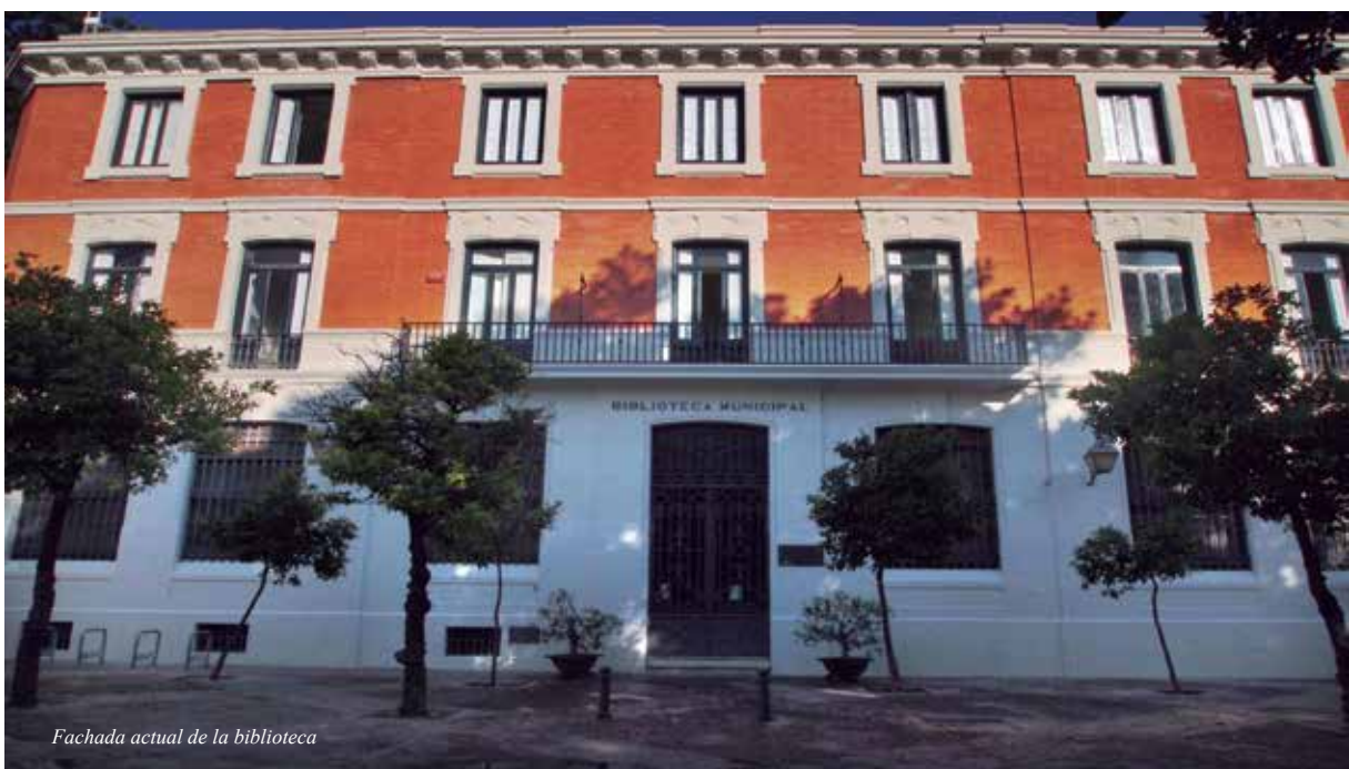
Fachada actual de la biblioteca