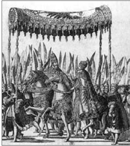
Fig. n.º 9.- Carlos V y el papa Clemente VII en la coronación imperial celebrada en Bolonia el 22 de febrero de 1530. Bajo un palio similar entraron Carlos e Isabel en Córdoba el 20 de mayo de 1526.