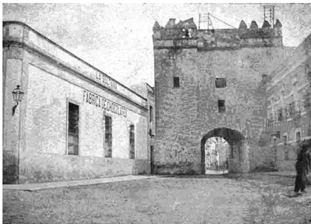
Fig. n.º 8. La Puerta de Osario (Córdoba) a principios del siglo XX, poco antes de su demolición. Por ella entraron Carlos V e Isabel en Córdoba el 20 de mayo de 1526.

La entrada real y la presencia de Carlos e Isabel en Córdoba están poco documentadas. La fuente más importante para conocer sus pormenores es el libro de gastos elaborado para la ocasión que tiene abundantes datos aunque incompletos. A través de ellos se puede concluir que el programa no varió mucho de los que se produjeron en Écija y Granada: recibimiento civil, discursos de bienvenida, desfile procesional, reci-