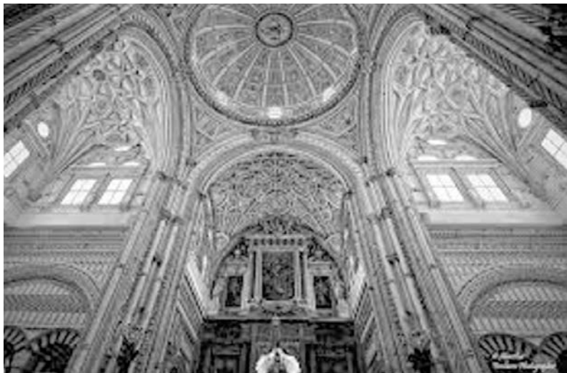
Fig. n.º 10 .- Crucero catedralicio de Córdoba.

¿Fueron ciertas estas palabras? No hay testimonio documental de ellas. En una obra de Juan Gómez Bravo escrita en el siglo XVIII se citan literalmente pero sin precisar el autor la fuente de información que tuvo. Parece ser que utilizó una carta