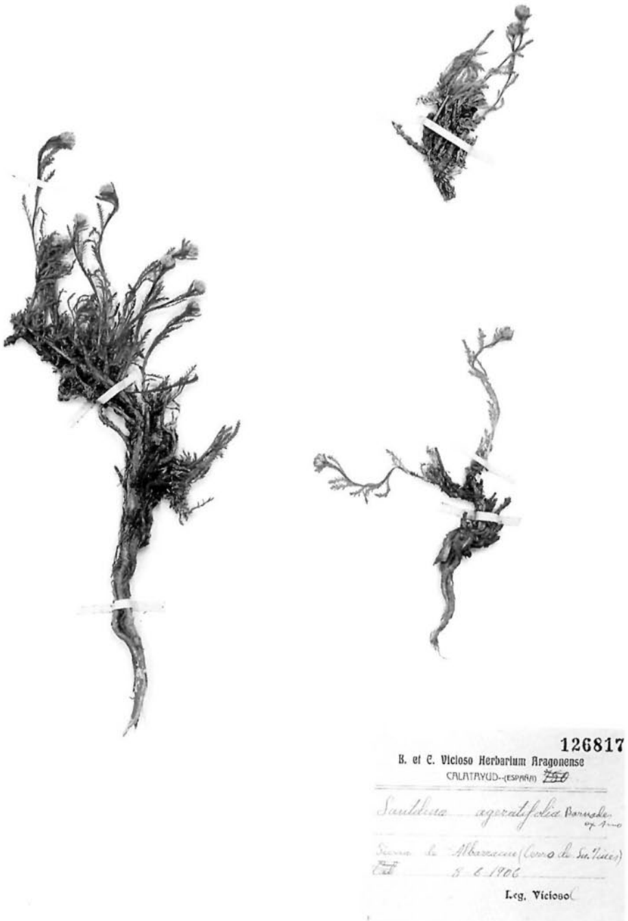
Fig. 3.—Material representativo de Santolina ageratifolia Barnades ex Asso.