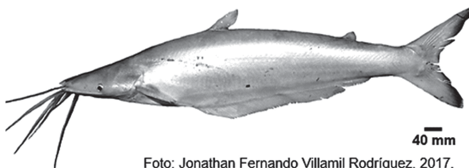
Figura 1. Hembra sexualmente madura de mapará Hypophthalmus marginatus .