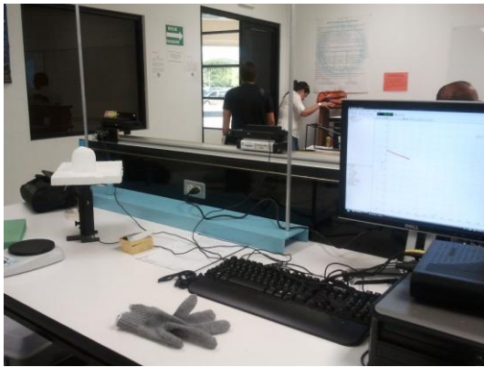
Figura 4. Medición de la masa del hielo seco con respecto al tiempo.

de sublimación, con respecto al tiempo. Fenómeno que no corresponde a un comportamiento ni lineal, ni cuadrático (figura 4). La intención de este experimento era mostrar a los estudiantes, que no todos los fenómenos necesariamente deben caer en comportamientos del tipo polinomial. Se tuvo que recurrir a una hoja de cálculo para observar el comportamiento aproximadamente exponencial del fenómeno. En la figura 5 se muestra la recolección de datos con el sensor en el DataStudio ®.