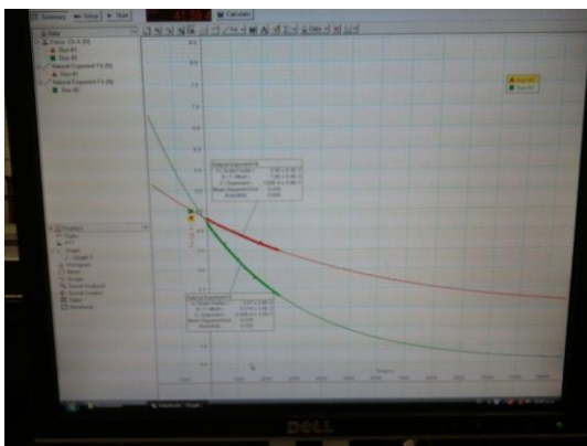
Figura 5. Gráfica de los datos recabados en el fenómeno de sublimación del hielo seco (sólido y triturado).