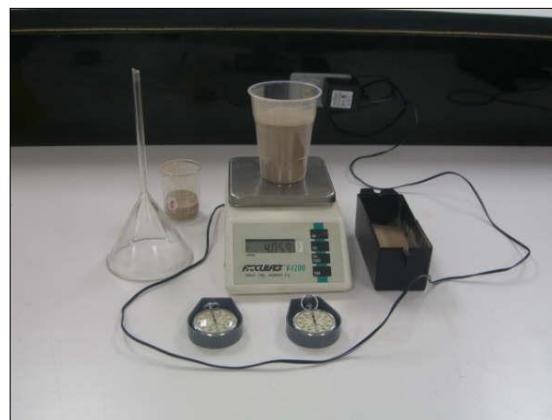
Figura 1. Herramientas usadas en el experimento de la arena.

Algunas de las acciones emprendidas en el desarrollo de la metodología se describen brevemente a continuación. Con la finalidad de que el estudiante se enfrentara a una situación de variación, se programó un experimento basado en el vaciado de arena, aprovechando la cualidad de que éste, se da con rapidez constante. Primeramente el estudiante toma lecturas de la masa de arena vaciada contra el tiempo, valiéndose de una báscula electrónica y cronómetro. Al alumno se le introduce a una dinámica de predicción, donde su único recurso es el uso de su antecedente matemático y la posibilidad de repetir tantas veces como desee el experimento, todo esto en el contexto de una experiencia inédita para él y sin el seguimiento de una secuencia de aprendizaje estrictamente establecida (Ver figura 1).