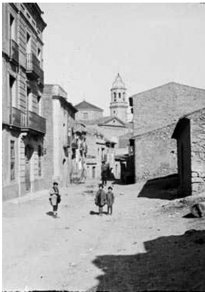
Carrer de l'Espluga de Francolí a començament del segle XX.

La Conca de Barberà en temps de la Mancomunitat de Catalunya. (1911-1923) . 2017, Montblanc, 2016.