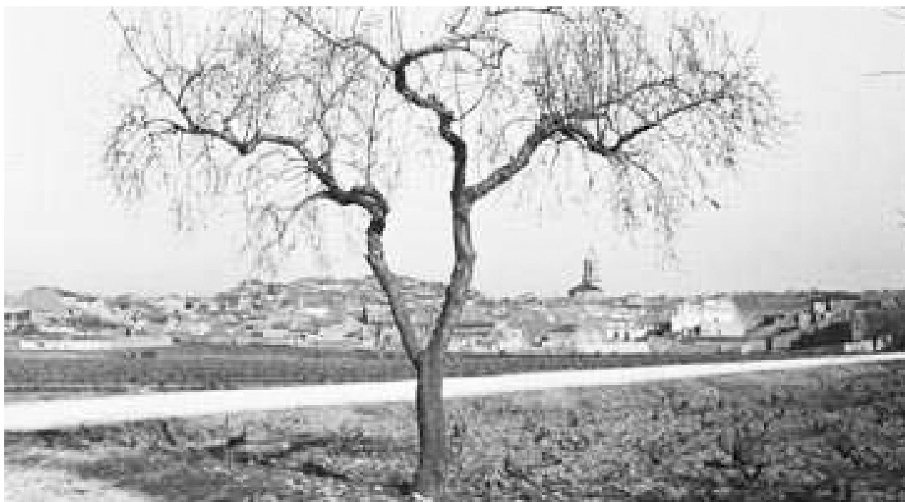
Vista de l'Espluga de Francolí a començament del segle XX.