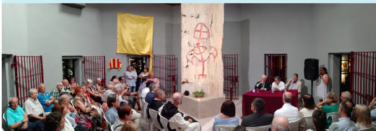
Moment de la col·locació de la placa recordant l'empresonament a Montblanc del cardenal Vidal i Barraquer