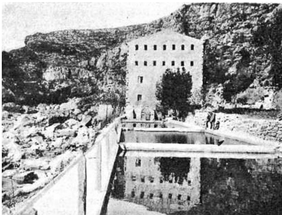
Vista del molí reconvertit en piscifactoria amb les tres basses. 1912.

Als Anuario del comercio de Bailly Bailliere consta en actiu, però sembla haver un "marge d'error", ja que segons el llibre roman fins a 1902 i en aquest any no figura cap activitat al molí dins la Contribució industrial. 47 Als Anuaris Riera d'aquests anys també consta en actiu, però el "marge" que dèiem abans es dispara fins a 1904 inclusivament. 48 El molí tancarà així el seu cicle paperer després de més d'un segle d'activitat.