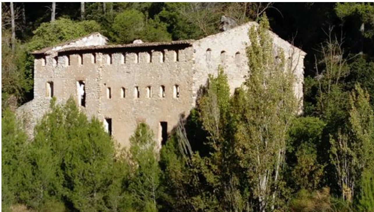
Aspecte actual del molí.

L' Estadística fabril i industrial de la província de 1876 ens confirma que Roselló estava llogant el molí. Hi fabricava 600 bales de paper per un valor de 2.400 pessetes i hi treballaven tres adults i un nen. La discrepància entre les dades dels membres de la família que figuren com a paperers als padrons consultats i aquestes últimes, posen en dubte la rigorositat de les xifres d'aquest registre. Segons aquest document el molí era la principal indústria del poble, seguida tan sols per una guixera, el producte de la qual estava valorat en 1.800 pessetes. 38