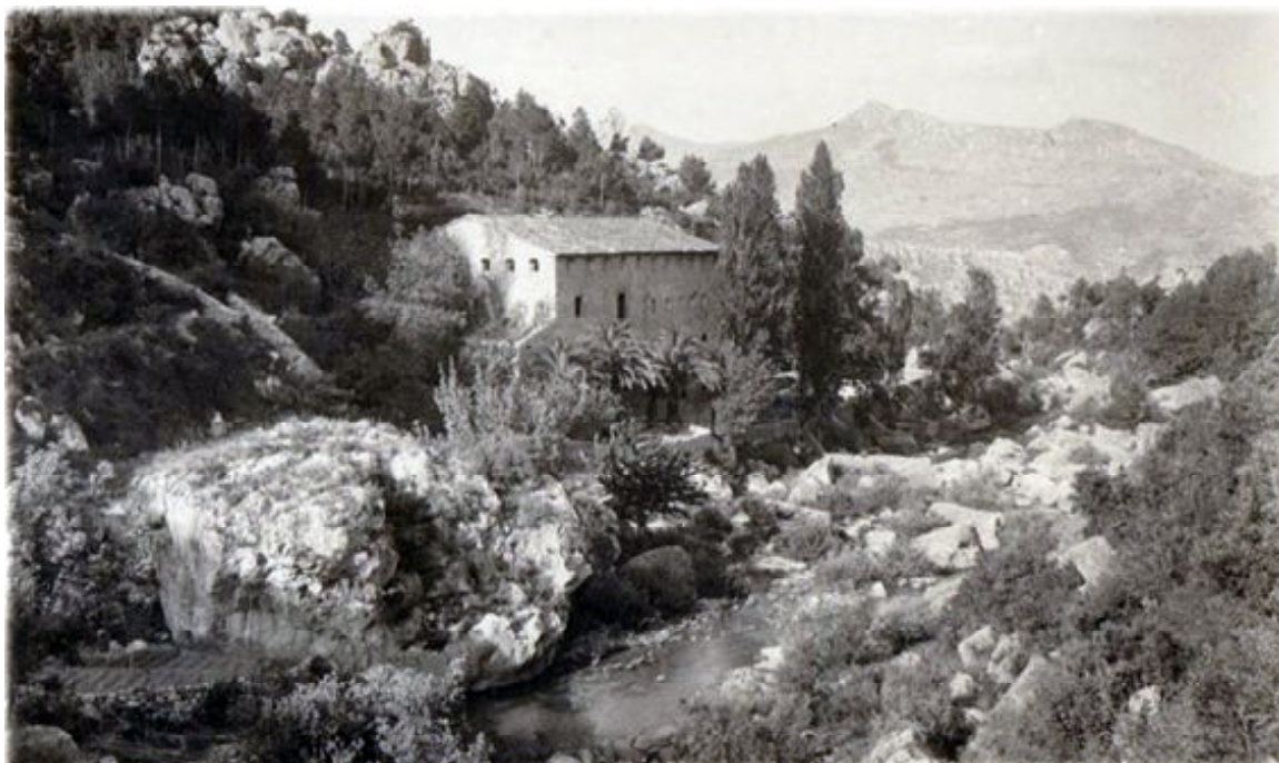
Postal del molí.