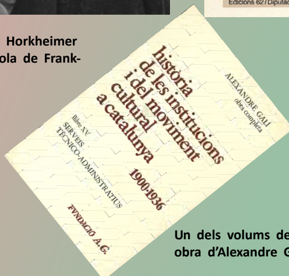
Un dels volums de la monumental obra d'Alexandre Galí