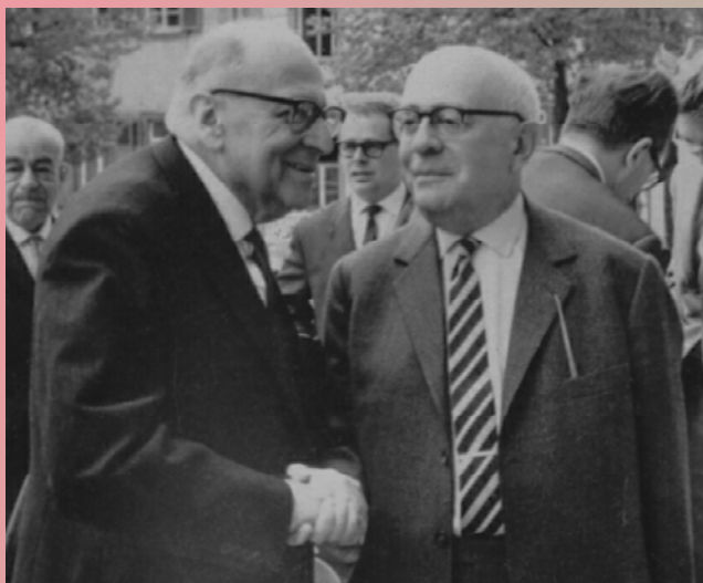
Theodor Adorno i Max Horkheimer en una trobada a l'Escola de Frankfurt