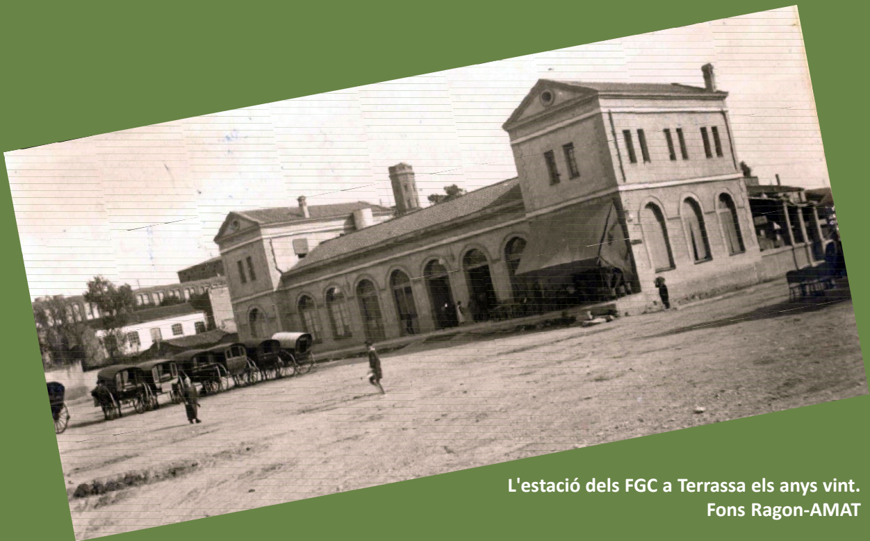
L'estació dels FGC a Terrassa els anys vint.