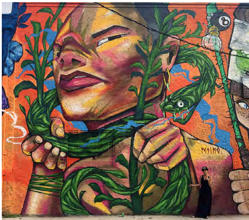
▪ Sin título (detalle), Wynwood, Miami (Estados Unidos), 2016 | Pésimo

Para lograr la articulación de esas tres categorías, junto con sus niveles, dimensiones y colonialidades con las que se enredan (tabla 1), lo que propongo es reelaborar la noción de la biocolonialidad del poder mediante la incorporación de la analítica heterárquica del poder (Castro-Gómez y Grosfoguel, 2007; Castro-Gómez, 2007, 2010; Grosfoguel, 2014). Así, lo que resulta de esa reelaboración es la categoría analítica de la biocolonialidad , y que puede entenderse metodológicamente como una genealogía decolonial.