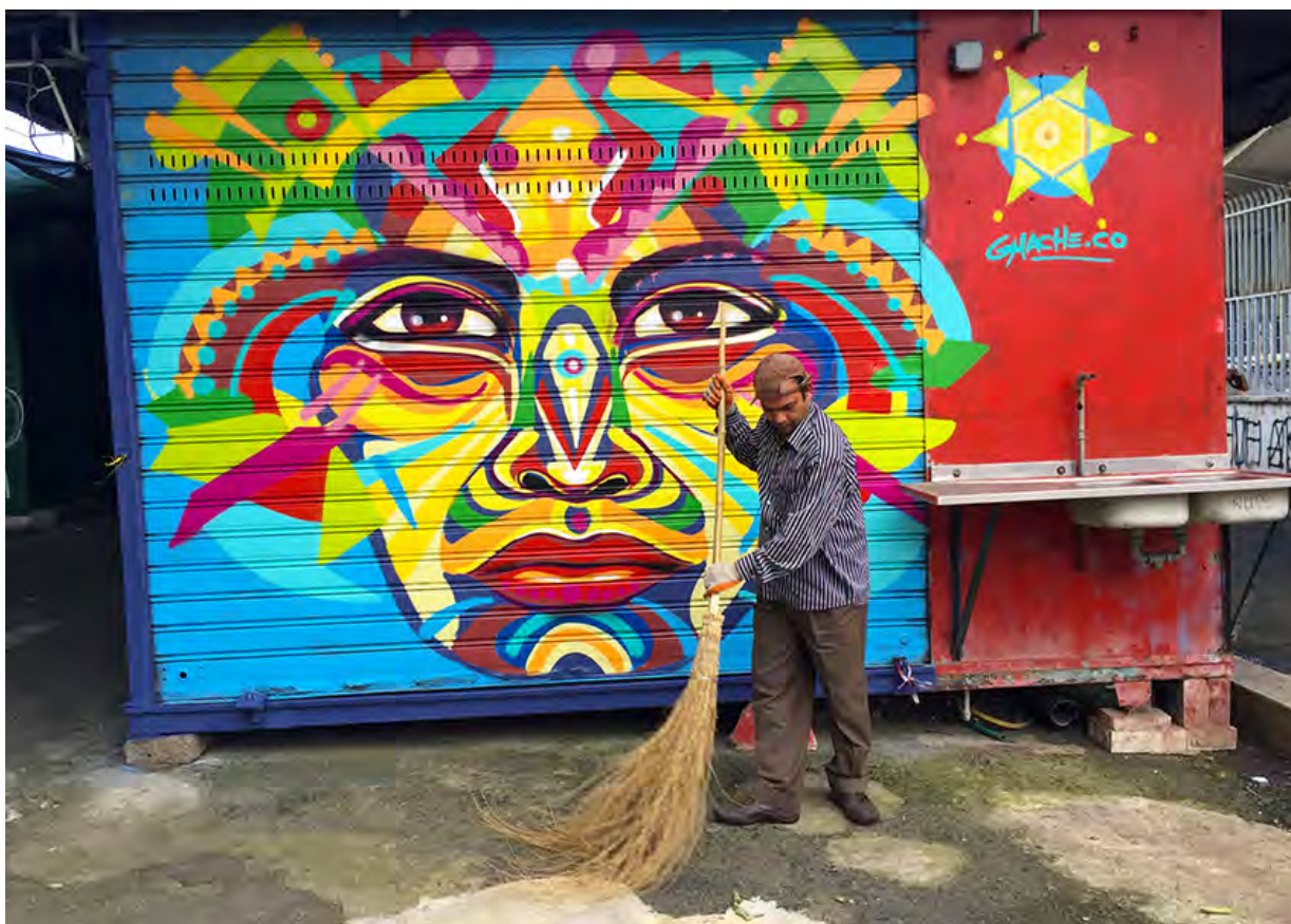
■ Sin título , mercado de Garbatella, Roma (Italia), 2016 | Guache

tegrías nacionales de biodiversidad de ambos países, se da cuenta, en primer lugar, de sus singularidades. Esto, con el fin de sostener la hipótesis de que a pesar de las singularidades, es posible observar un patrón universal de poder sobre las naturalezas y culturas en América Latina. En segundo lugar, mediante el análisis de las prácticas (implementación de las estrategias), a través de la revisión de los planes, programas y proyectos que llevaron a cabo esos países, se da cuenta de lo que significa en la práctica una política de protección de la biodiversidad. Y, por último, al dar cuenta de los procesos de resistencia a dichos discursos y prácticas, se señalan las agencias (resignificaciones, adopciones o adaptaciones) de los pueblos a los que han llegado aquellos planes, programas y proyectos. Esa aplicabilidad teórico-metodológica de la biocolonialidad permitió, en últimas, articular las estructuras macro, meso y microfísicas del poder que operan sobre la biodiversidad en América Latina, evidenciando cómo el control no es sólo sobre “recursos” (la biodiversidad o Pachamama), sino sobre el ser, el género y el saber de pueblos indígenas, comunidades afro y campesinas.