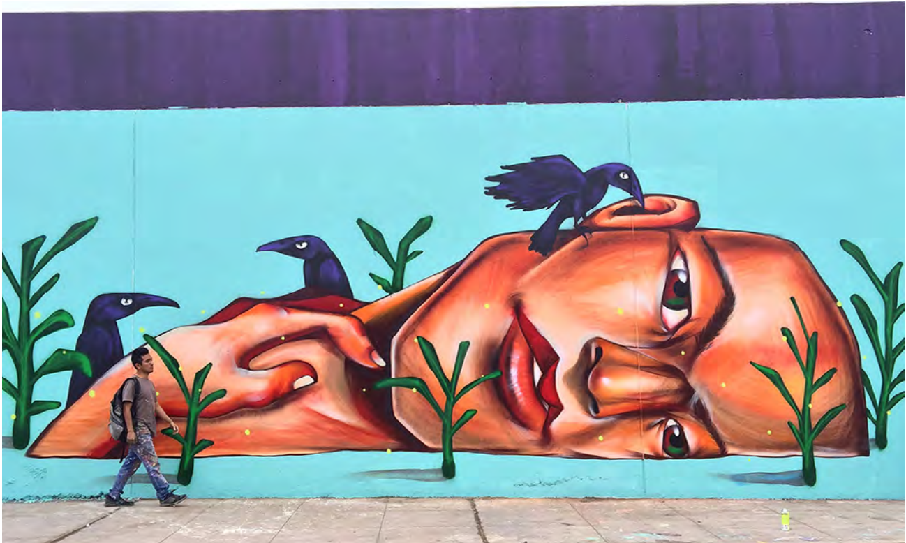
▪ Sin título, Lima (Perú), 2015 | Pésimo

por ejemplo 15 , el colonialismo de Foucault converge, aunque por vías diversas, con la premisa fundamental de los estudios decoloniales, a saber, sin colonialidad no hay modernidad 16 , porque siempre se trató de la modernidad y el colonialismo (De Oto, 2012).