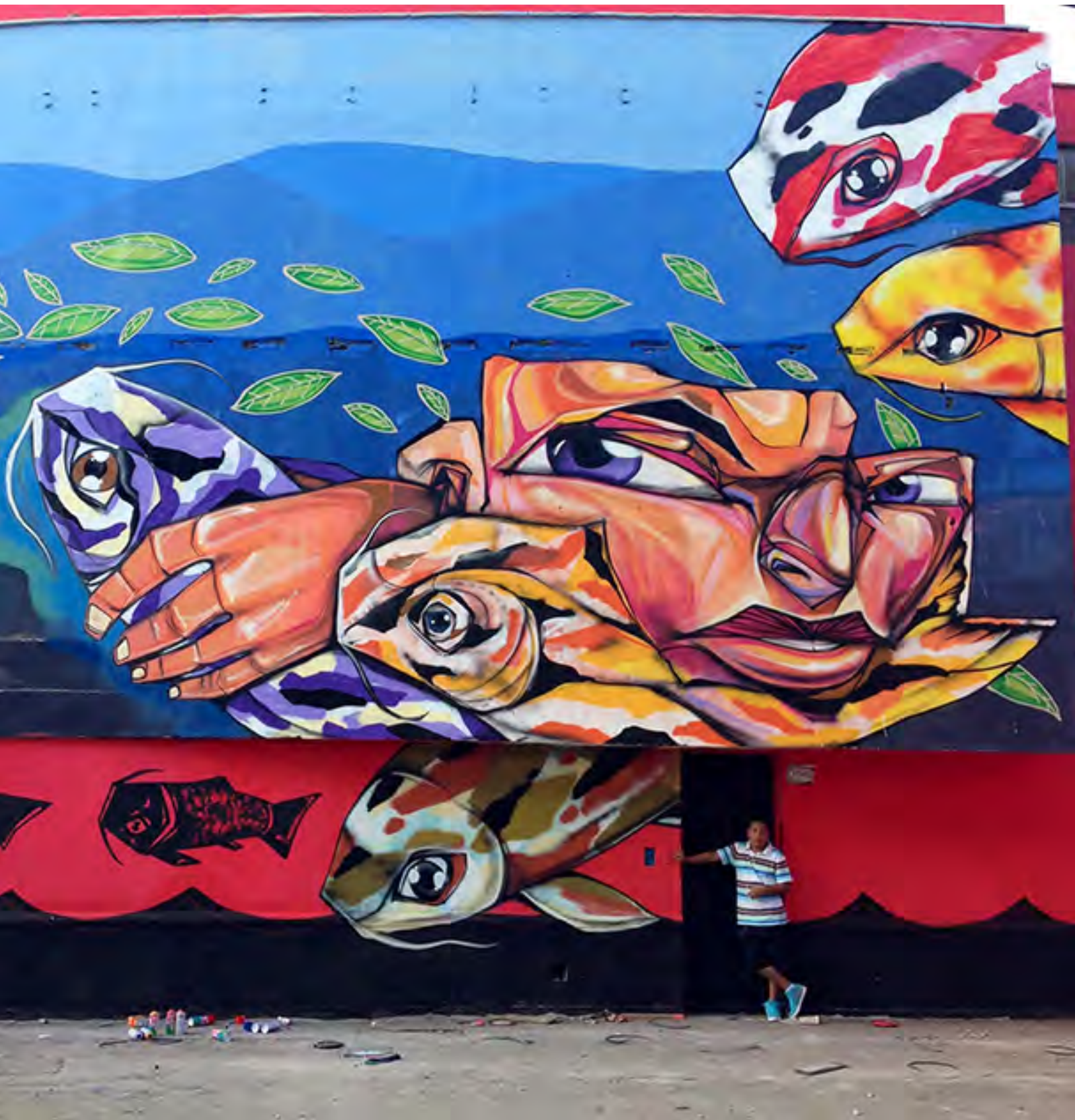
▪ Sin título , Lima (Perú), 2014 | Pésimo