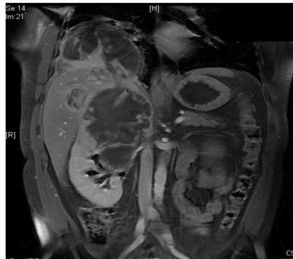
Imagen 4: TAC toraco-abdominal con ocupación de hemitórax derecho por masa en parte inferior y hemotórax en parte superior.

RMN abdominal donde se observa masa heterogénea en polo superior renal que infiltra segmentos hepáticos VI y VII, vena intrahepática y base pleural derecha.