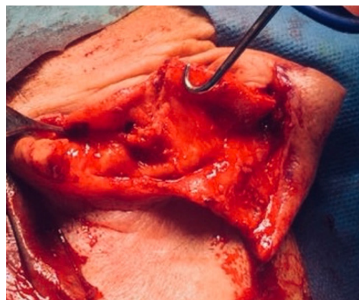
Figura 5. Despegamiento de colgajo hasta surco retroauricular con triángulo de Burrow.