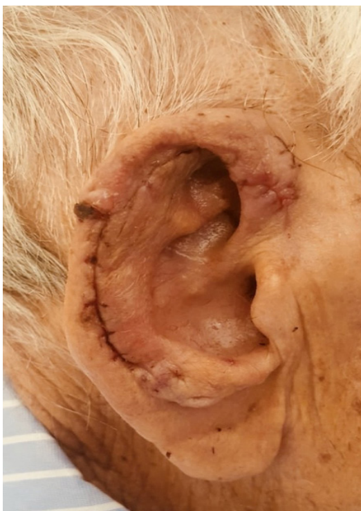
Figura 7. Resultado tras retirada de puntos.

La reconstrucción del pabellón, en caso de pérdida de sustancia, ya sea postraumática o posquirúrgica, plantea un problema complejo al cirujano, que debe esforzarse en restituir lo mejor posible las características de esta estructura, de forma que se obtenga una oreja de aspecto natural [3, 4].