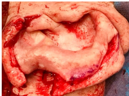
Figura 4: Incisión y despegamiento de colgajo.