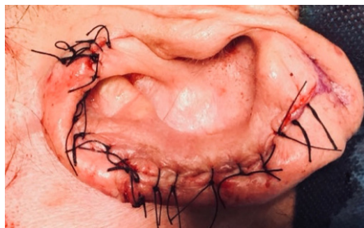
Figura 6. Cierre y reconstrucción.